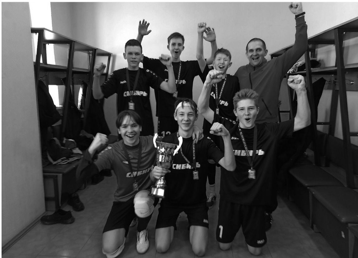
На снимке: победители спартакиады учащихся

Результат футболистов Сорокинского района подтверждён с 2019 года, тогда мы первенствовали в возрастной категории 2003 – 2004 г.р. Примечательно, что на трибунах именно парни из того золотого состава поддерживали своих сегодняшних преемников. А в финале, как и сейчас, играли с голышмановцами. Поздравляем ребят с высоким спортивным результатом, а тренера – с педагогическим успехом!