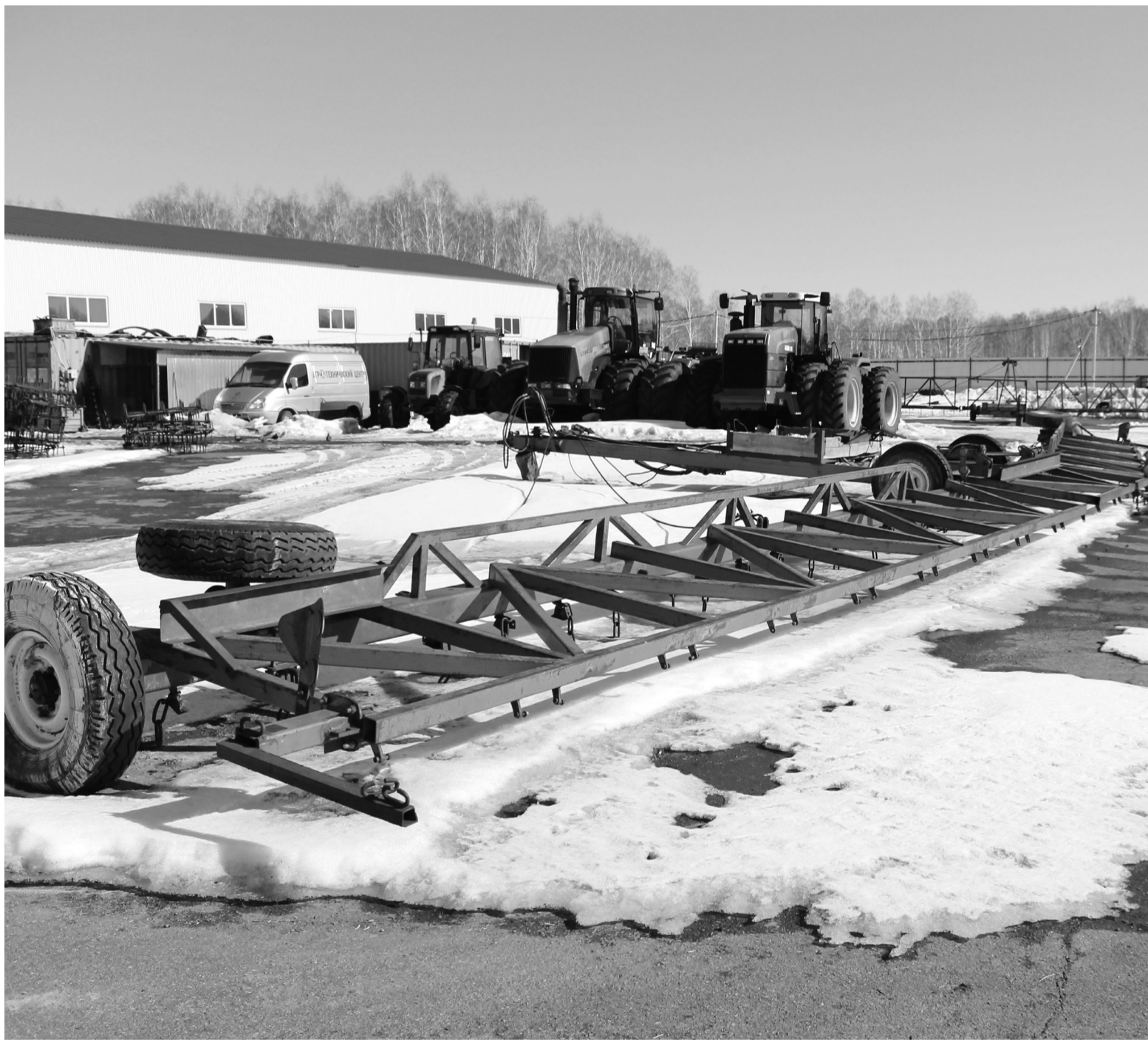
Борона полностью готова к работе, осталось подцепить её к трактору и выйти в поле