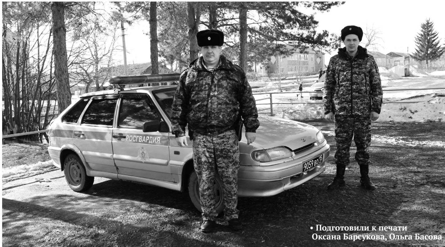
• Подготовили к печати Оксана Барсукова, Ольга Басова

31 сентября 2016 года в Тюмени создано Управление Росгвардии по Тюменской области, в состав которого вошли ОМОН, СОБР, авиационный отряд специального назначения, а также подразделения лицензион-