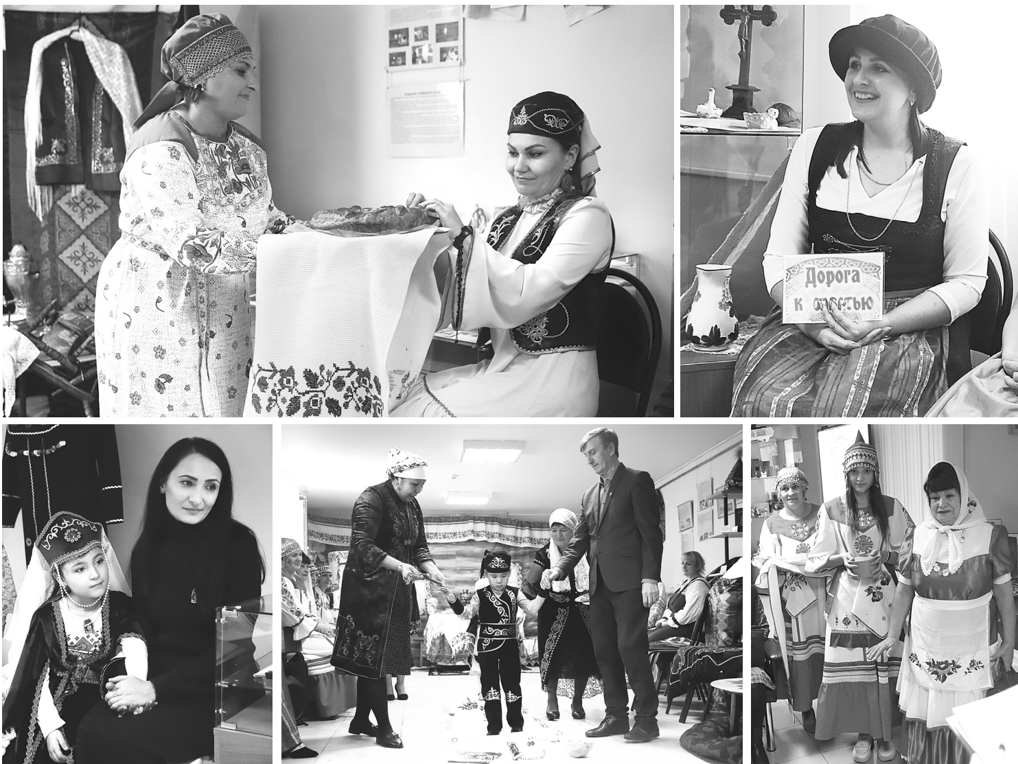
Участники мероприятия познакомили гостей со своими обычаями, национальными костюмами и кухней

В Голышмановской центральной библиотеке закрылась выставка «В культуре края – душа народа»