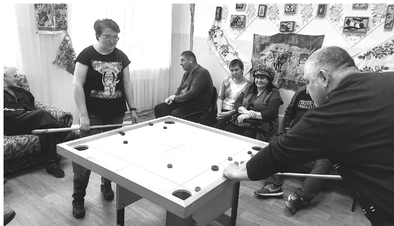
Активисты ВОИ весело проводят время в дружеском кругу за настольными спортивными играми

В Голышмановской организации Всероссийского общества инвалидов интерес к настольным спортивным играм не угасает.