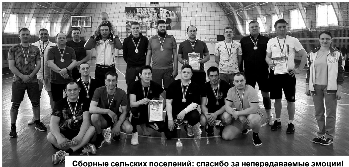
Сборные сельских поселений: спасибо за непередаваемые эмоции!