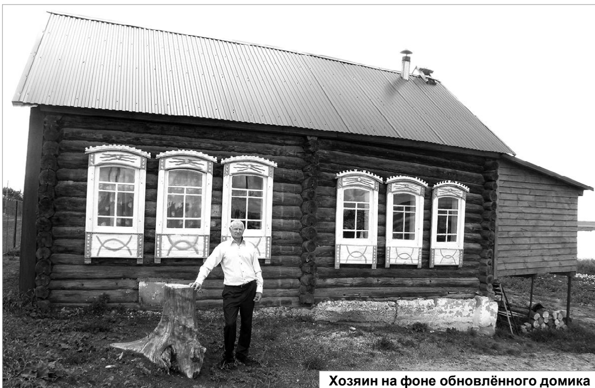
Хозяин на фоне обновлённого домика