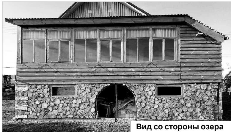
Вид со стороны озера