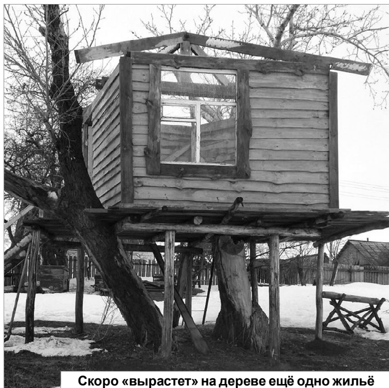
Скоро «вырастет» на дереве ещё одно жильё