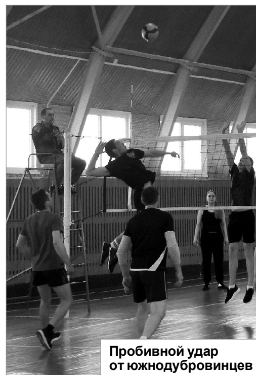
Пробивной удар от южнодубровинцев