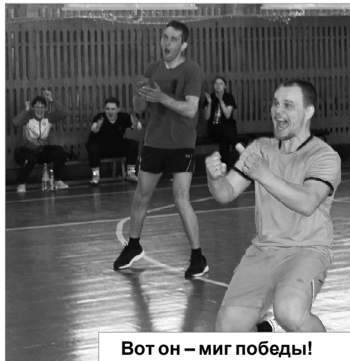
Вот он — миг победы!