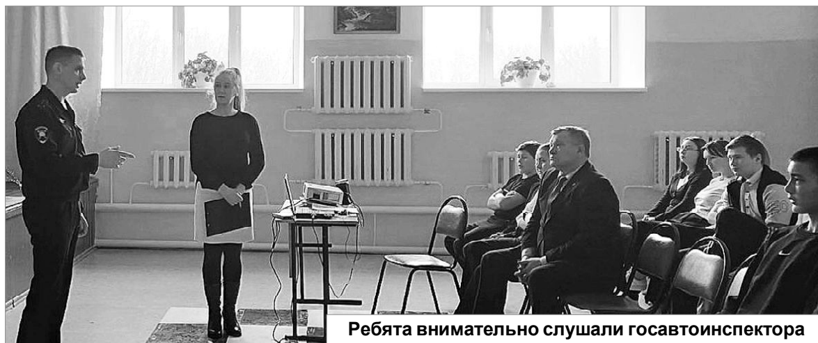
Ребята внимательно слушали госавтоинспектора