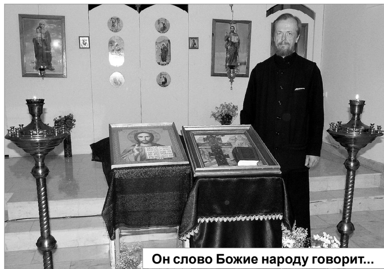
Он слово Божие народу говорит...

на Литургии – на утренней службе им можно быть до середины, а услышав слова: «Изыдите, оглашенные...» – уйти. На главную часть остаются крещёные, – пояснил отец Алексий. – Храм – место, в котором принимают и некрещёных. Церковь не дает запрета на это. Некрещёные также могут ставить свечи, познавать религию. Нельзя препятствовать человеку на пути к вере. За некрещёных могут молиться крещёные, однако, нельзя отдавать записки на Литургию. Их не примут ни за живого, ни за мертвого человека, если он был некрещёным.