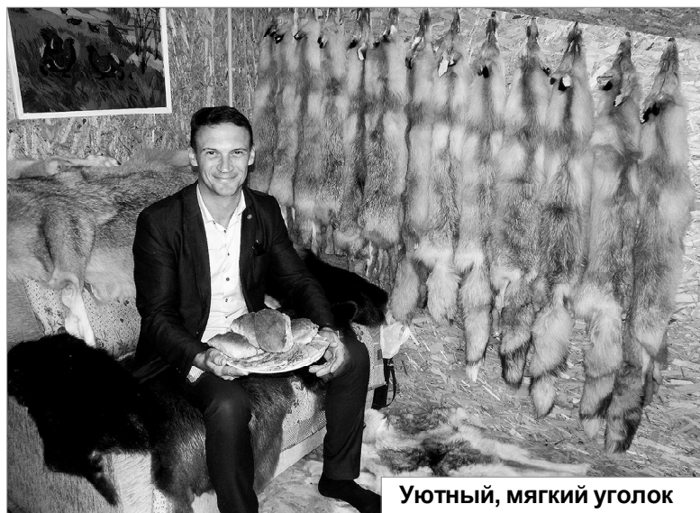
Уютный, мягкий уголок