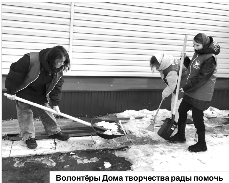
Волонтеры Дома творчества рады помочь

Жизнь... О ней можно говорить без конца, и можно сравнить с рекой, всегда полноводной, стремительно несущейся. Для кого-то она кажется серой, однообразной, и, думается, в ней нет ничего хорошего, доброго, чистого, светлого... Да такого быть не может! Жизнь ведь так разнообразна! Посмотри под другим углом, и она вдруг засияет всеми цветами радуги! Только надо посмотреть! Только надо увидеть! Только понять! И ещё – постараться её сделать такой.