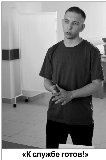
«К службе готов!»