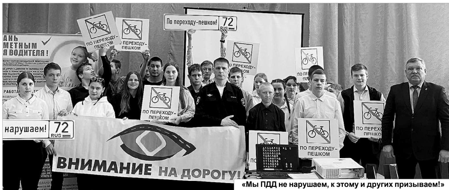
«Мы ПДД не нарушаем, к этому и других призываем!»