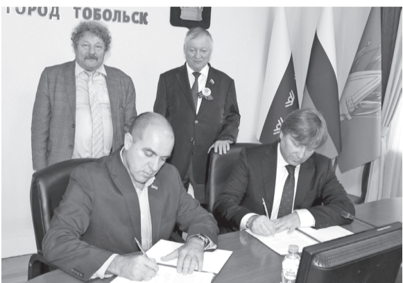
Подписание соглашения о сотрудничестве по развитию шахматного движения между Тюменью и Тобольском

Первым делом легендарный гроссмейстер побывал в тобольских школах №№ 9, 16 им. В.П. Неймыве и гимназии им. Н.Д. Личмана, которые славились своими шахматными командами и победами и где этот интеллектуальный вид спорта особенно развивается и прививается школьникам. Каждый раз, приезжая в наш город, Анатолий Карпов проводит шахматные турниры, награждает ребят за успехи в соревнованиях, непременно дарит подарки, в числе которых шахматные доски с его подписью и книги по методике игры.