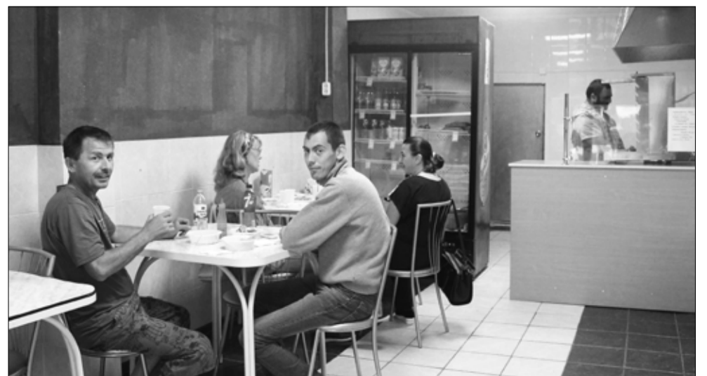
Кафе «Full House» супругов Торосян готово принимать посетителей до одиннадцати вечера