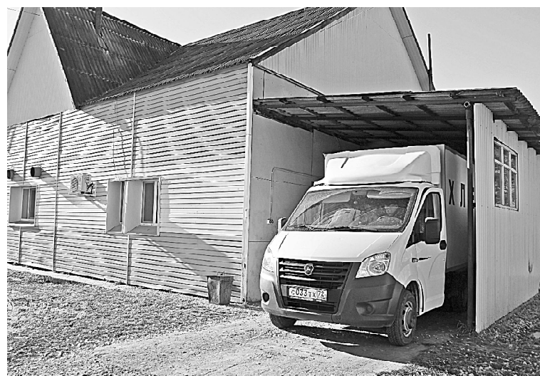
➤ Машина «Хлеб» прибыла за свежей выпечкой