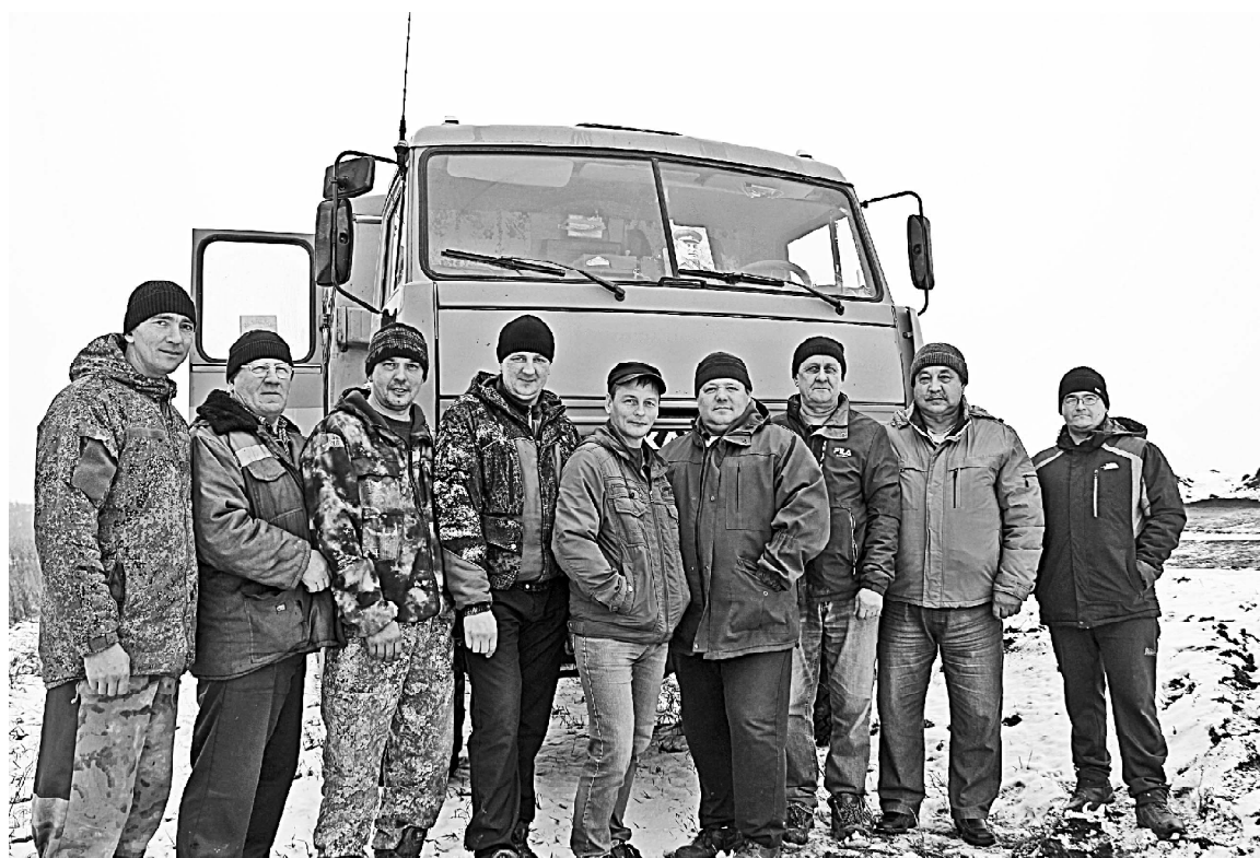
➤ Водители автосамосвалов