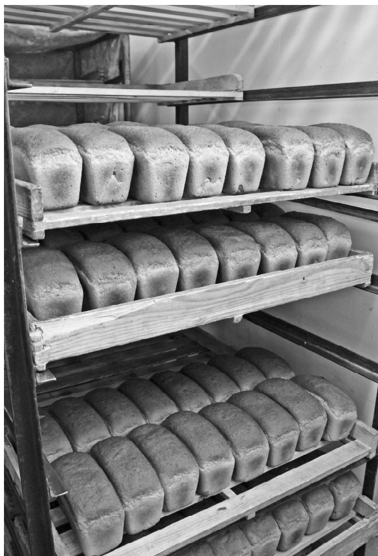
➤ «Ночной» хлеб к утреннему столу