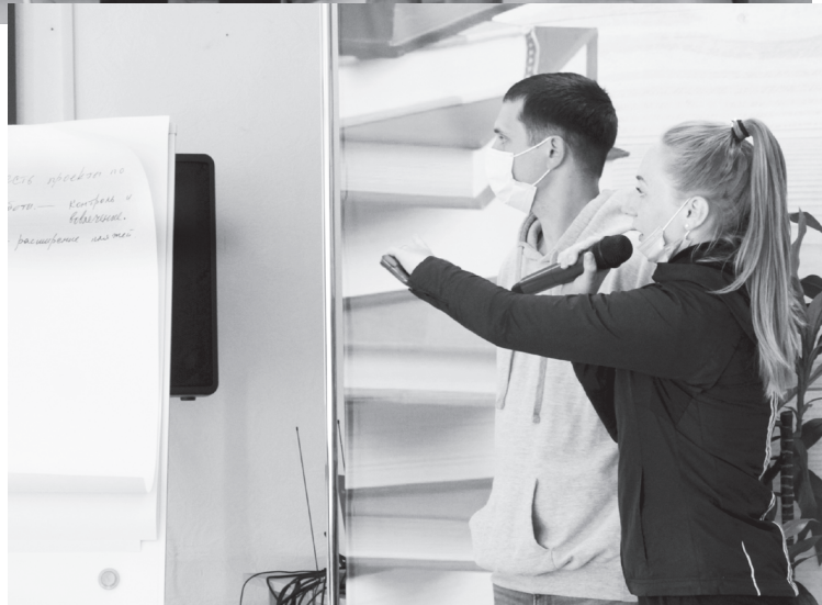
Защита молодёжных проектов в рамках деловой игры