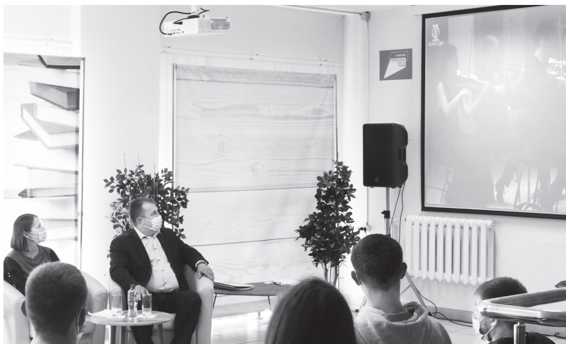
Услышать шедевры мировой классики теперь можно в Центральной районной библиотеке