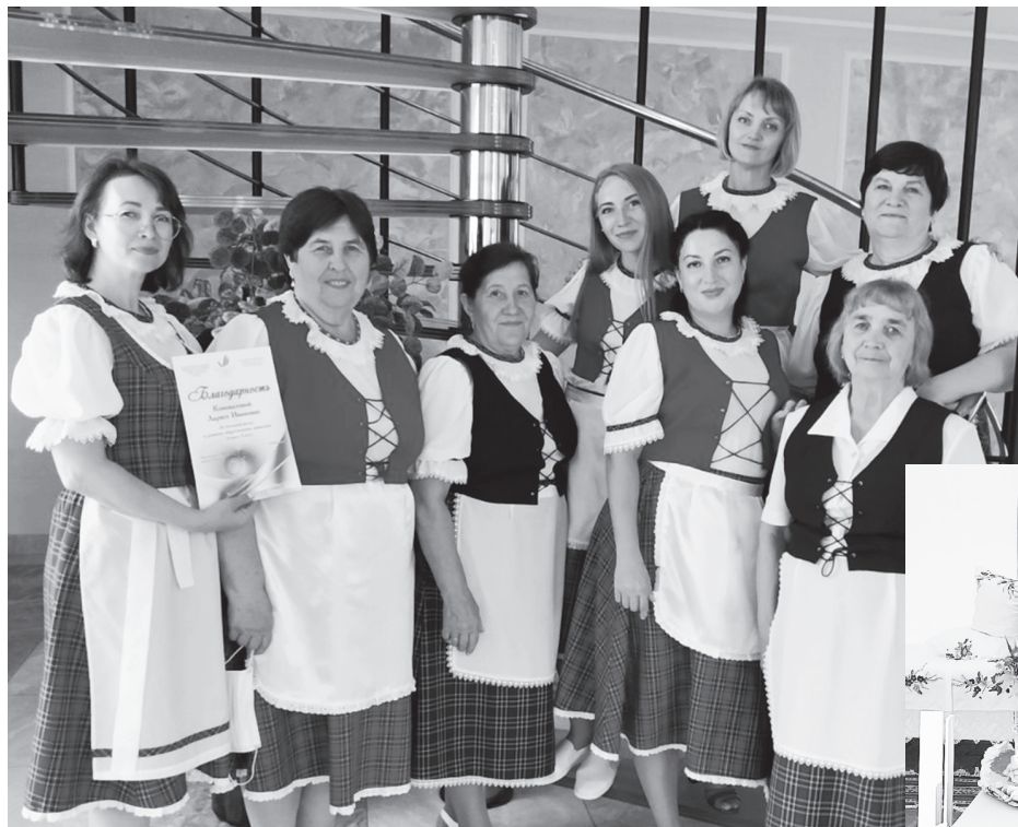
Работа юргинцев по сохранению национальных традиций отмечена благодарностью Центра немецкой культуры

Татьяна ЗАМЯТИНА