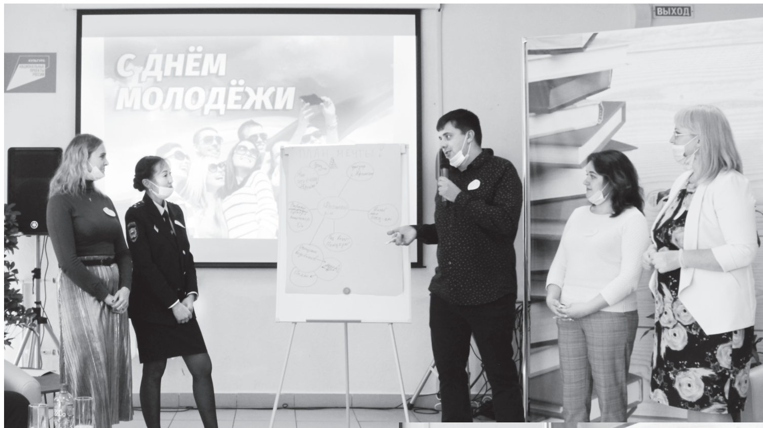
В «Плане мечты» – термальный источник «Юргала», чистая река, пляжи, молодёжный развлекательный центр, жильё для молодых специалистов