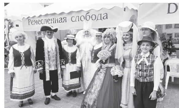
Костюмированное выступление заводоуковской делегации