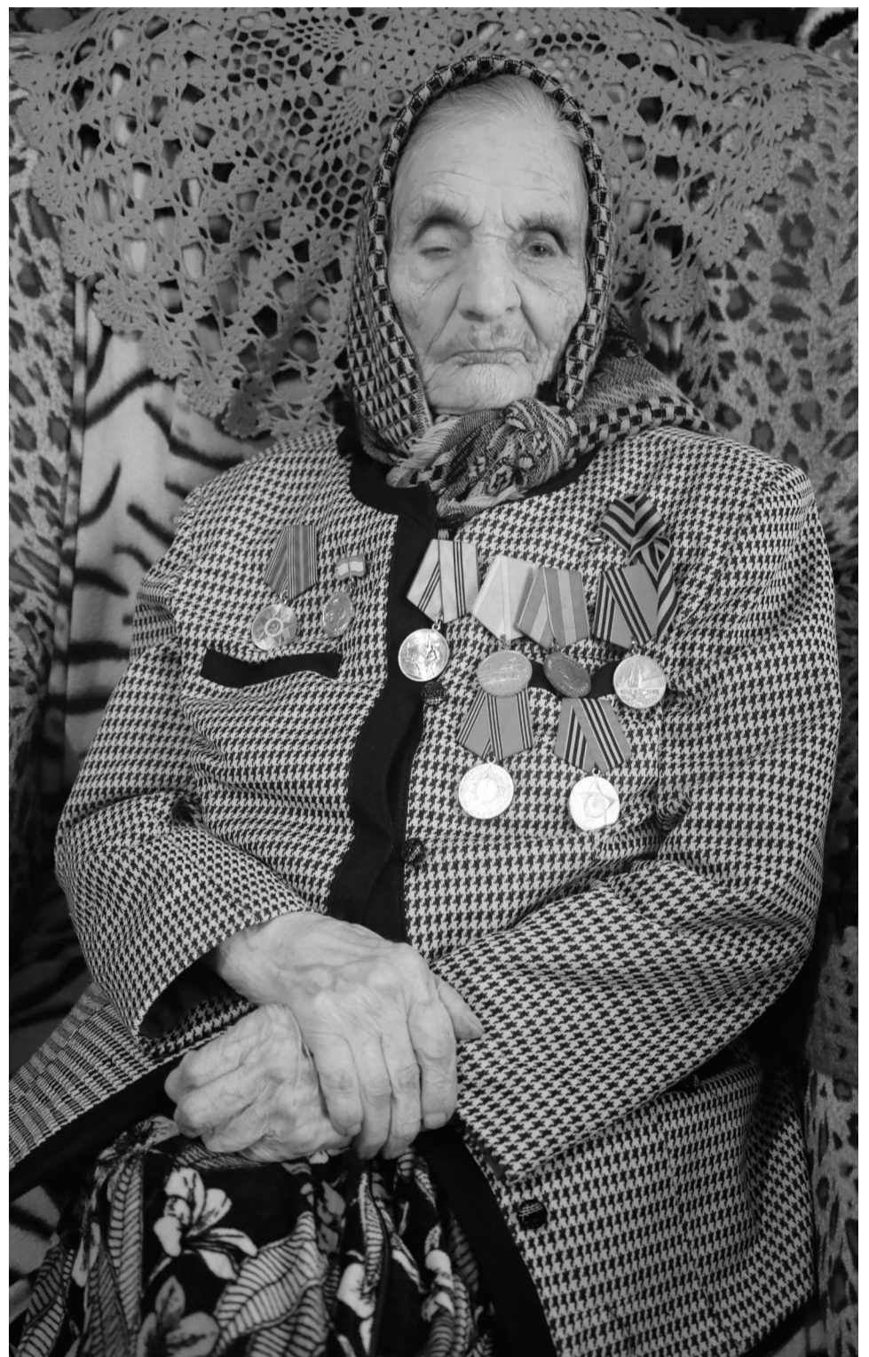
Долгожительница встретит своё 100-летие в конце ноября.