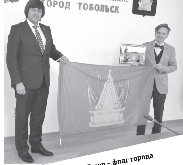
В дар – флаг города

предшествующим (наш город посетило более 250 человек). 2020 год, который сопровождается коронавирусной ситуацией, для нас стал толчком для переосмысления и внедрения новых подходов. Это касается многих сфер: предпринимательства, муниципалитета, сферы услуг, туроператоров. Важно, чтобы мы все вместе были открыты, заинтересованы в продвижении нашего города – его красоты, ландшафтной и рукотворной, исторического наследия. У меня есть идея по развитию мототуризма. Всех поздравляю с праздником. Вы молодцы. Выстояли в непростой период. Всем желаю успехов.