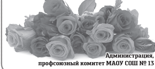
Администрация, профсоюзный комитет МАОУ СОШ № 13

Примите искренние поздравления с замечательным праздником – Днём учителя! Пусть свет, который вы дарили и дарите своим ученикам, зажигает звёзды и ярко освещает жизненный путь, а доброта возвращается в виде успехов и благополучия! Крепкого вам здоровья, радости, новых свершений и открытий, удачных находок и замечательных уроков, отзывчивых учеников и понимающих родителей, мира и добра. Да будет благословенно имя твоё, Учитель!