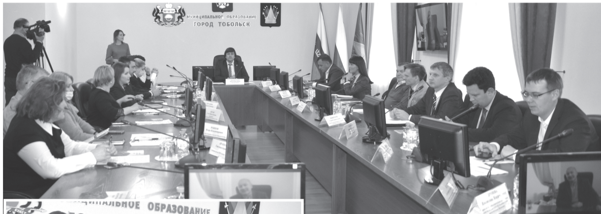
Один ум хорошо, а двадцать лучше

– В этот день хочется выразить надежду, что перед нашим любимым Тобольском, нашей Тюменской областью – большие перспективы развития. Мы проверили себя на прочность в столь непростой год. Сделали вывод, что мы вполне конкурентоспособны на туристическом рынке. Нам нужно выстроить приоритеты, поставить задачи, которые позволят наращивать турпоток. В 2019 году он намного вырос по сравнению с ему