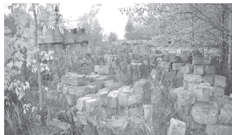
«Кладбище» бетонных изделий

На разработку проектной документации требуется 251,76 тыс. рублей. Глава однозначно сказал, что подписывать документ не будет, так как непонятно, на кого выделять средства. Этот вопрос он назвал юридически не доработанным. Но то, что к нему ещё вернутся, без сомнений.