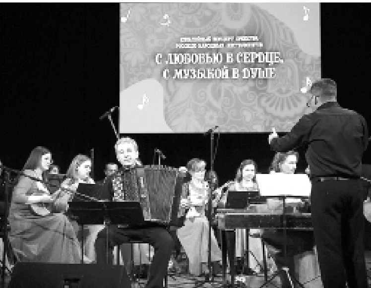
► На сцене оркестр русских народных инструментов

За добросовестную прокурорскую службу неоднократно поощрялась прокурором области, награждена Генеральным прокурором Российской Федерации знаком отличия «За верность закону» II степени, «Медалью Руденко».