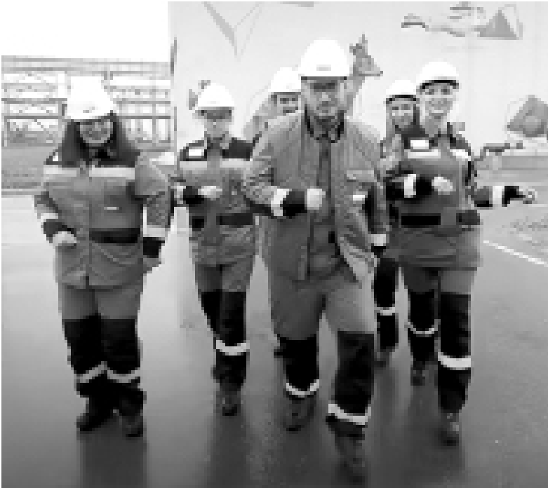
► Участники телепроекта «Классная Тема!» побывали на «ЗапСибНефтехиме»

В Тобольском многопрофильном техникуме (ТМТ) – опорном ссузе компании в регионе – призеры проекта «Классная тема!» обсудили с коллегами инновационные подходы к обучению, возможности профорientации и методы мотивации учеников и студентов. Им показали лабо-