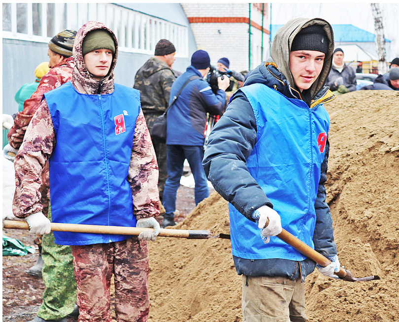
За короткий период времени сделан большой объём работ

Районный штаб гражданской обороны и чрезвычайных ситуаций активно включился в противопаводковую кампанию 2024 года