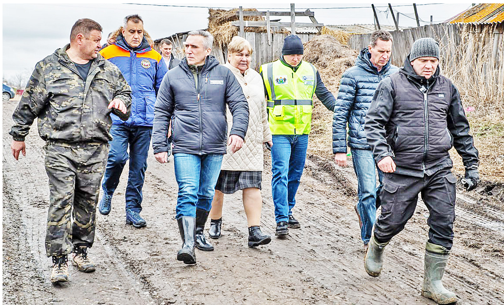
Ситуация с половодьем на контроле у главы региона

Режим ЧС введён в Тюменской области заблаговременно, с 8 апреля. С 16 апреля в Казанском районе объявлена эвакуация населения