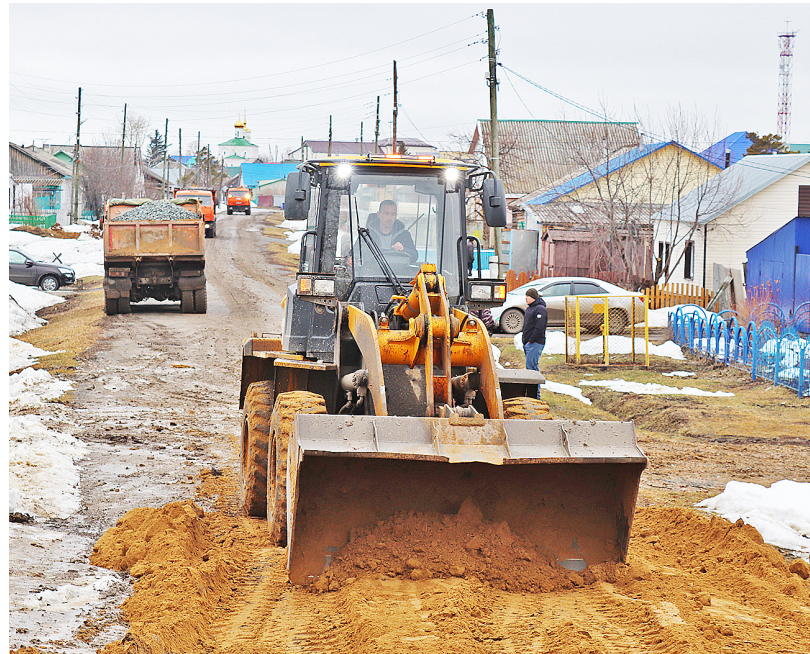
Силы и средства ДРСУ-5 направлены на отсыпку дамб