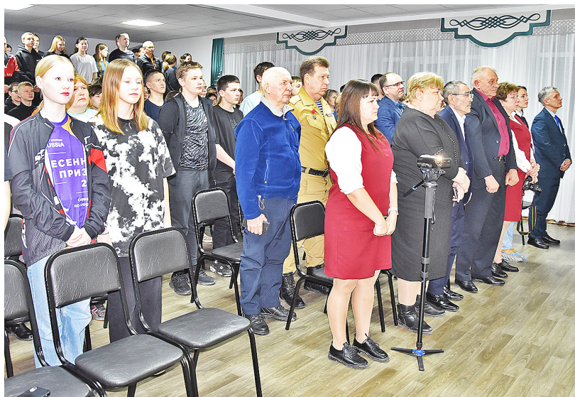
Присутствующие почтили память Героя России Жумабая Раизова минутой молчания

Из дневника Жумабая: «... Солдата нельзя жалеть, он этого не заслуживает, но мне было обидно за них, они не встретили своего 19 лета, совсем ещё дети. Но снаряд или пуля не выбирает.