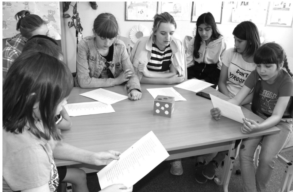
Отдыхая, ребята познают новое...