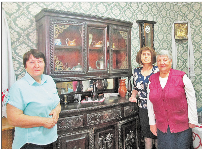
Много интересного и познавательного узнали экскурсанты в ильинском музее

Завершился сентябрь нашим общим сбором в казанском парке на праздничном форуме «На 55 с плюсом!». В этот день пенсионеры смогли поучаствовать в мастер-классах, которые проводили работники музея, библиотеки, пели частушки, под музыку старых грам-