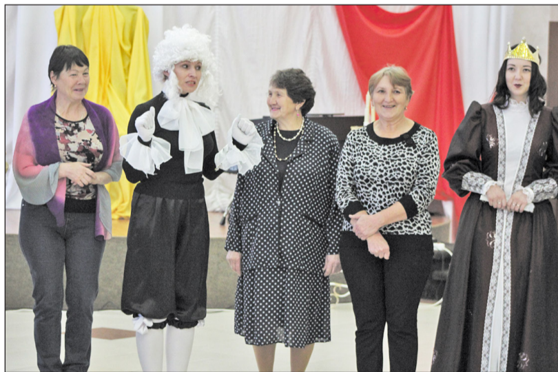
Танцмейстер учил присутствующих на балу хорошим манерам

пластинок плясали вместе с работниками музыкальной школы и дома культуры, смотрели концерт. Жизнь вокруг просто кипела: люди переходили от палатки к палатке, пили чай, фотографировались, приветствовали друг друга, шутили, обнимались, объединялись в группы. Много было желающих посетить палатку, организованную медицинскими работниками, которые охотно давали советы по укреплению здоровья, некоторым рекомендовали посетить врача. Пенсионеры дали положительную оценку этому мероприятию, особенно были довольны те, кто активно отдыхал, с удовольствием участвуя в работе всех площадок.