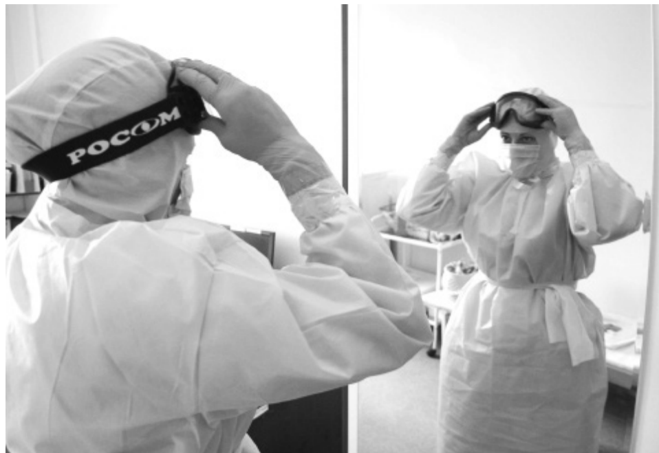
Каждый день врачи рискуют здоровьем, спасая чужие жизни

– Работаю вахтовым методом на Севере. Трудюсь в большом коллективе, со многими общаюсь. Поэтому важно