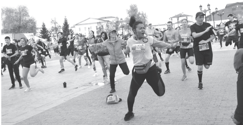
Разминка в драйв