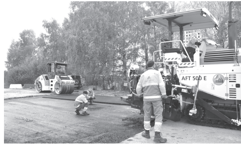
Последнее слово за дорожниками

Испытали сложности жители тех домов, мимо которых раньше проходила «девятка». Маршрут движения автобуса был на время изменён. Возмущённые тем, что «девятка» не там сворачивает, пассажиры свой гнев обрушивали на кондукторов. Пострадали воспитанники ДЮСШ-1 – фигуристы и хоккеисты, которым приходилось через несколько кварталов тащить сумки со спортивным снаряжением во дворец спорта «Кристалл».