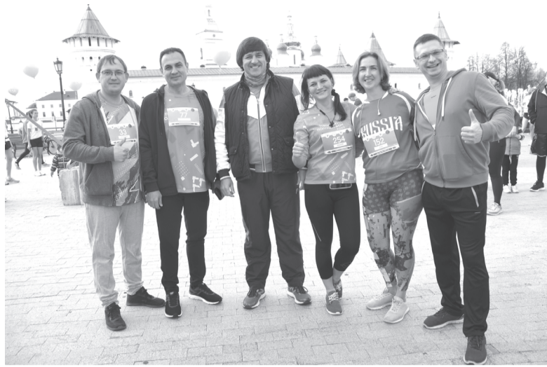
За несколько минут до старта

– Я уверен, что ставший традиционным Тобольский полумарафон полюбит вас. Здесь можно приятно и с пользой провести время в семейном кругу или в кругу друзей, единомышленников. Хочется пожелать спортсменам новых побед, выносливости, которая приведёт к финишу. Уверен, что наступит тот день, когда наш полумарафон трансформируется в настоящий марафон, а может быть, и в ультрамарафон. В Тобольске есть два классных беговых клуба – «Ампер» и «Тоб-Ран». Они своим примером показывают нам, что такое бег, что