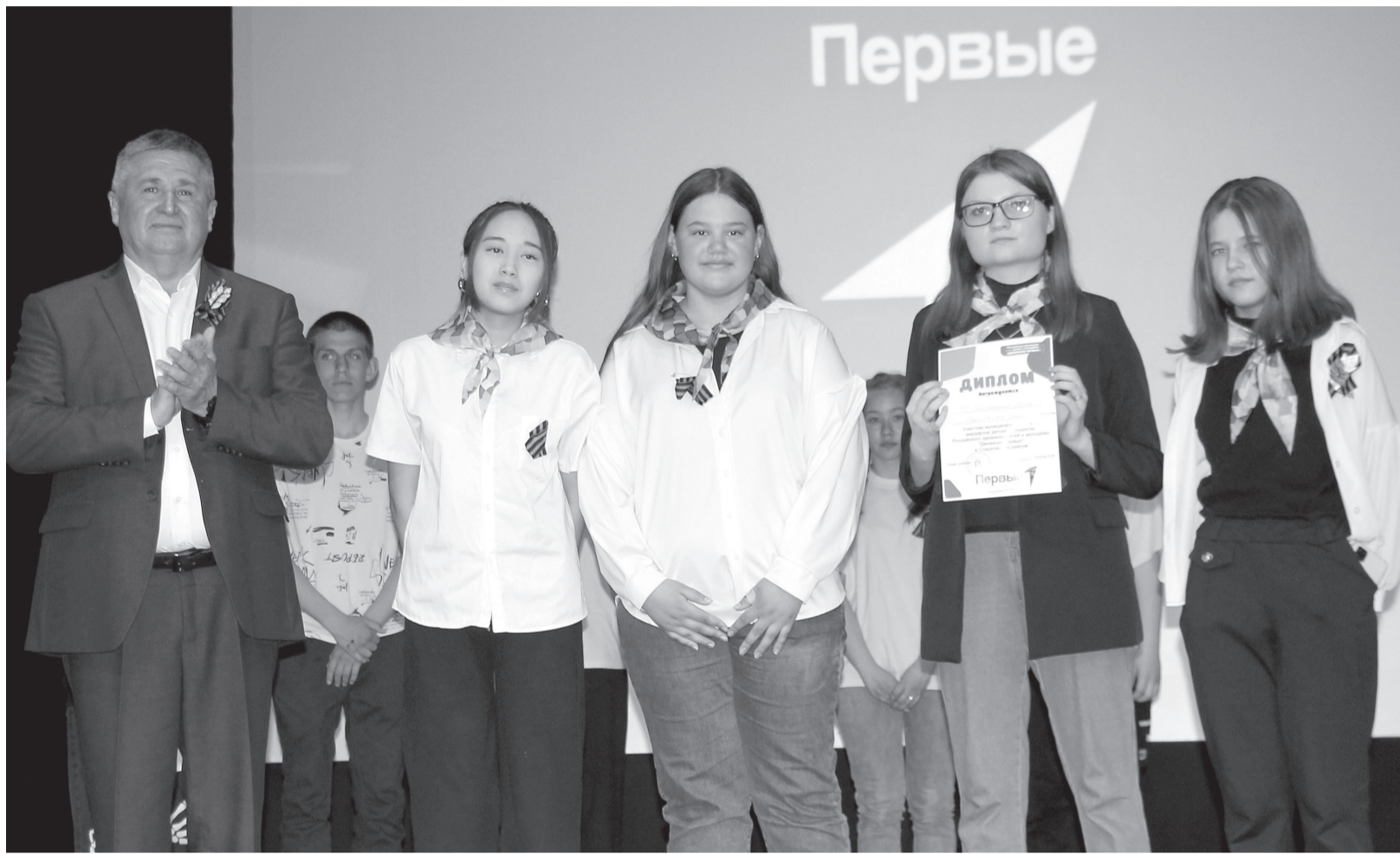
Победителям муниципального этапа предстоит серьёзная подготовка к областному конкурсу.

Проекты ребят были разнообразными: на темы экологии, спорта, социальных сетей, развития родного села и патриотиз-