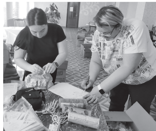
Активисты Сладковского района собирают помощь землякам, участвующим в специальной военной операции.