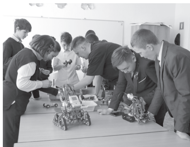
Мероприятие прошло интересно, весело и с пользой.