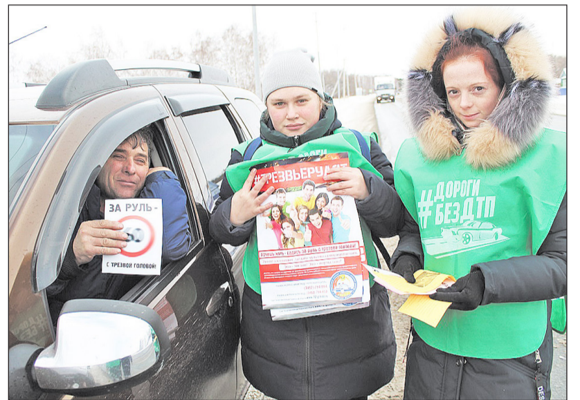
Участники акции встречали поддержку и понимание водителей

Место проведения акции – участок автодороги Ишим – Казанское – граница с Казахстаном – выбрано не случайно. ДТП, произошедшие здесь в декабре прошлого года, унесли две жизни.