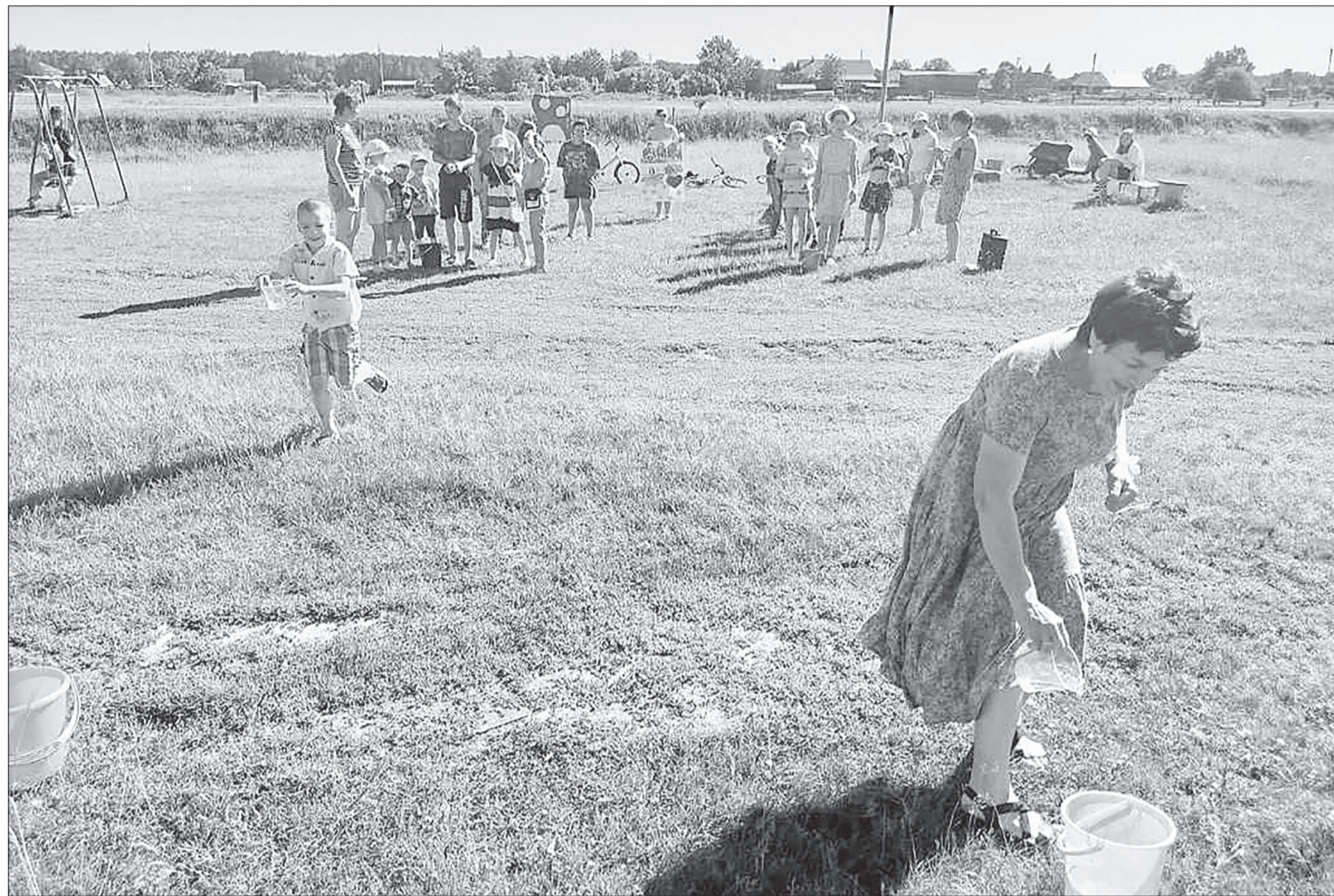
«Водолейка» так понравилась всем присутствующим, что игру повторяли снова и снова.

– Этот год в России – Год семьи, и наши мероприятия так или иначе связаны с этим на-