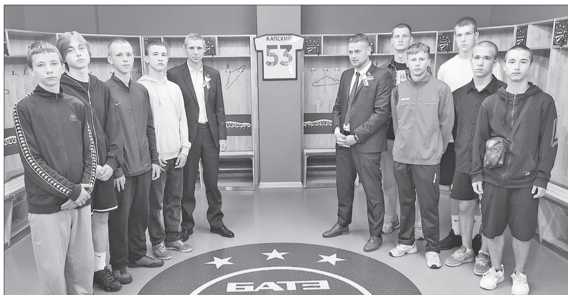
Нижнетавдинцы во время экскурсионного маршрута посетили стадион борисовского футбольного клуба «Батэ».