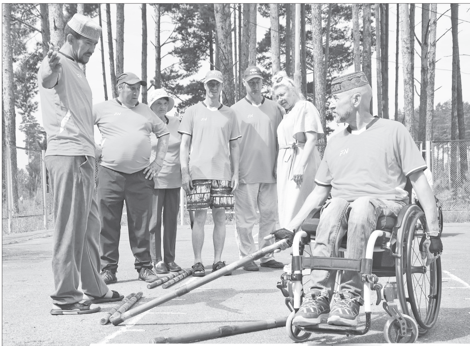
Сборная команда Нижнетавдинского района по городошному спорту среди инвалидов обсуждает стратегию перед первой матчевой встречей.