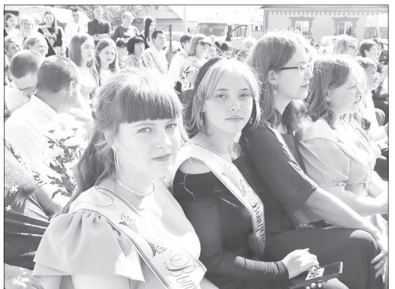
В этом году в Ялуторовском районе 63 выпускника