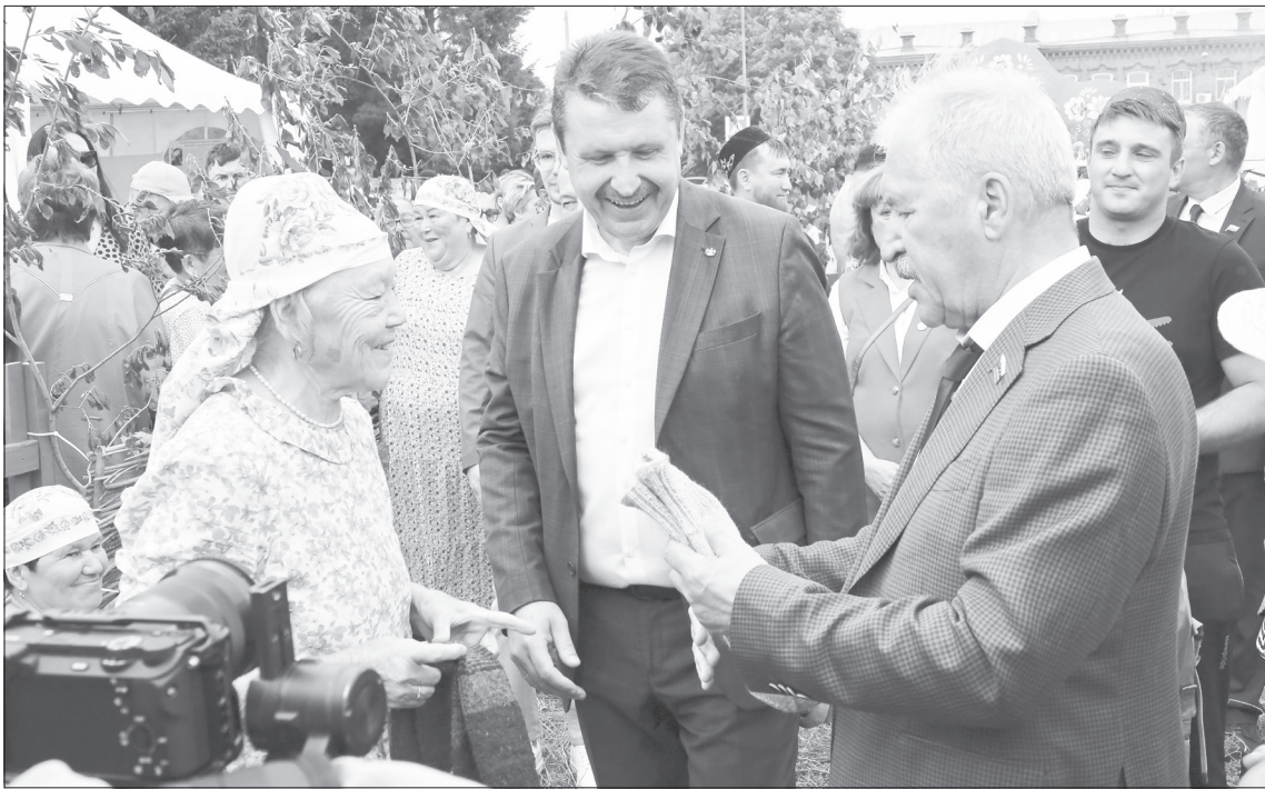
На татарском подворье гостям показали и рассказали, как помогают воинам СВО