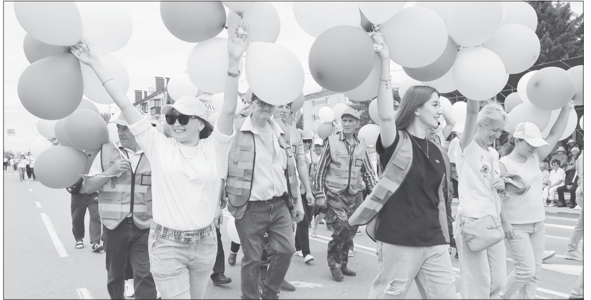
В театрализованном шествии в этом году приняло участие более двух тысяч человек

Арт-фестиваль «Город-молодость» закончился шествием со стометровым полотном и красочными масками.