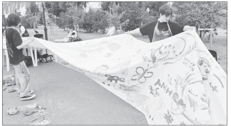
Стометровое полотно продолжали расписывать даже под мелким дождём