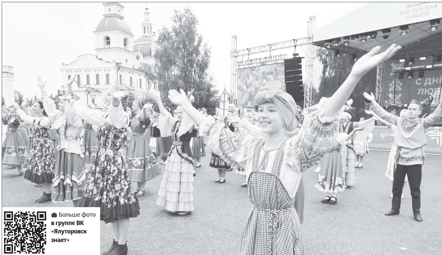
Разные национальности города представили в общем танце фестиваль «Венок дружбы»