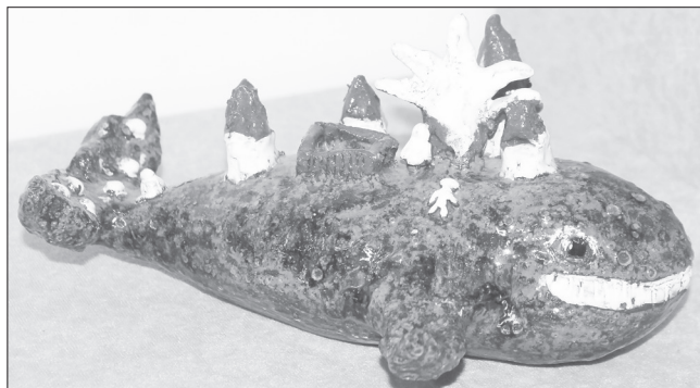
Юные керамисты представили посуду, фигурки животных и сказочных персонажей, а также изделия с узнаваемыми сценами из жизни

В работах отражены общечеловеческие темы жизни, семьи, дружбы, подвига, любви к Родине и другие. Также на выставке можно увидеть изображения животных, литературных героев, сцен из мифов и