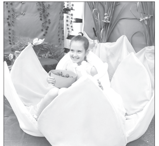
У фонтана разместились красочные фотозоны нового арт-фестиваля «Цветущий город». На площадке прохожие задерживались надолго. Сделать красивые снимки хотелось у каждой локации