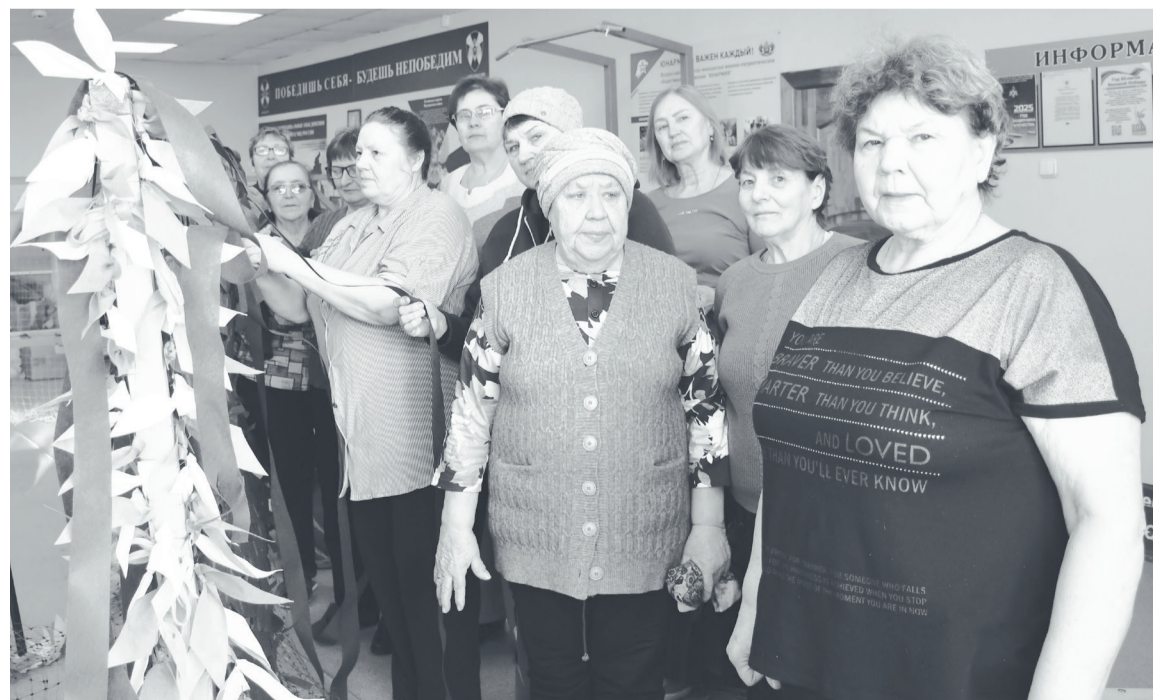
Одну маскировочную сеть добровольцы успевают изготовить за один день.

Светлана ЖАМАТОВА Фото автора и из архива «Нити жизни»