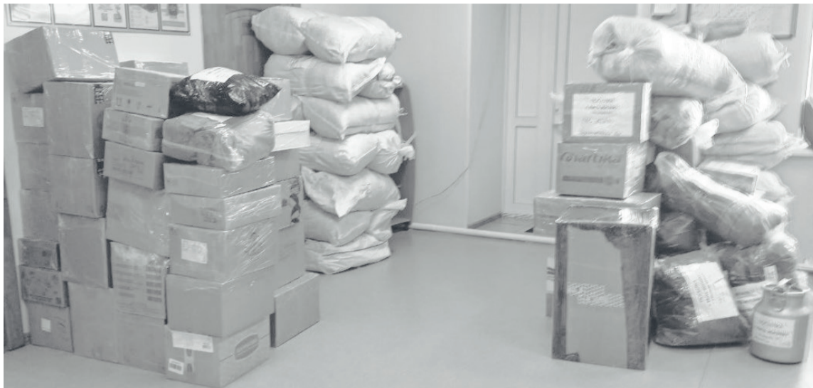
Вот так выглядит упакованный гуманитарный груз перед отправкой на СВО.