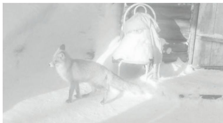
Лиса смело зашла на территорию домовладения.

Владимир Георгиевич сообщил, что с 22 января по 20 февраля Госохотдепартаментом Тюменской области на территории общедоступных охотничьих угодий Упоровского округа проводятся мероприятия по регулированию численности лисиц. Силами Упоровского сектора планируется отстрел до 95 особей.