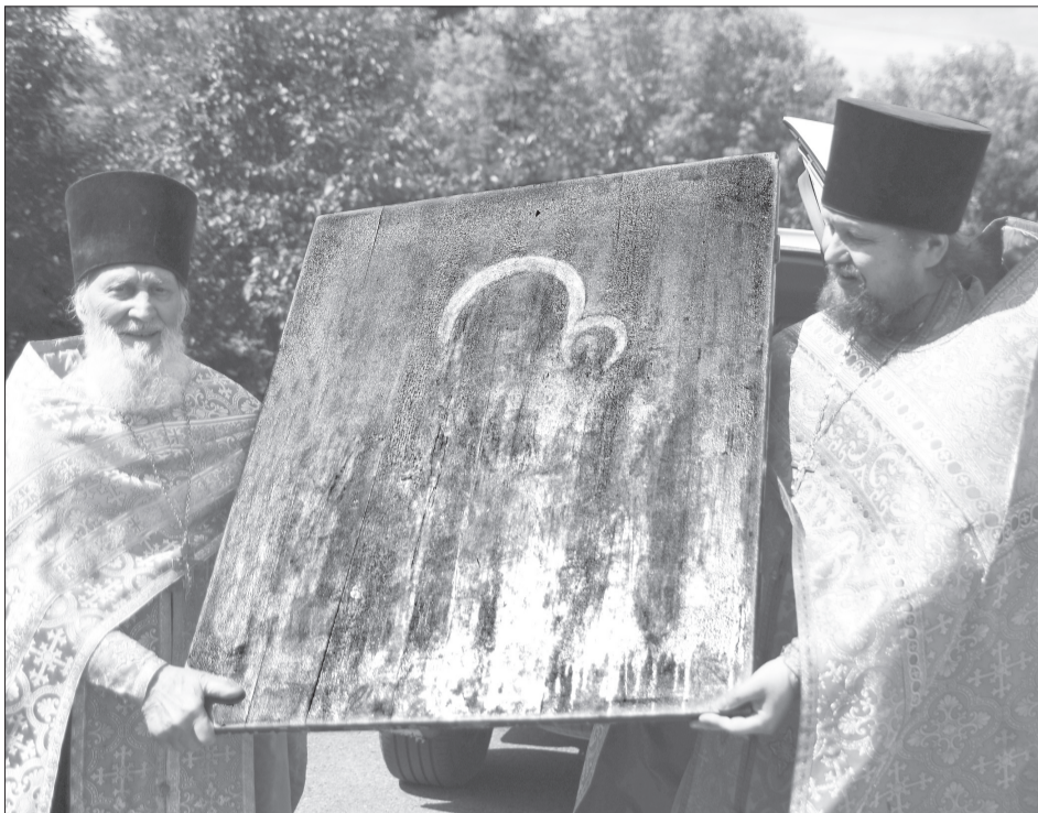
Верующие прошли крестным ходом по центру города до Сретенского собора

250 лет назад. Народное сказание, публикация которого имеется в «Епархиальных ведомостях» за 1913 год, гласит, что во второй четверти XVIII века, когда многие жители Суерской слободы стали жертвами свирепствовавшей в ней моровой язвы, народ обратился в Рафаиловский монастырь с просьбой написать для них икону Богородицы. Взятся за дело иконописец иеромонах Макарий. После поста в течение шести недель и приобщения Святых Христовых Таин иконописца и просителей образ был написан и перенесён в Суерский храм. После молебна перед иконой Божией Матери эпидемия моровой язвы прекратилась. Слух о чуде, дарованном Богородицей, облетел окрестные остроги, и по просьбам верующих начались крестные ходы с Суерской иконой. Так, в Исетском остроге исцелился от глазной болезни управляющий, а затем прекратился падеж ско-