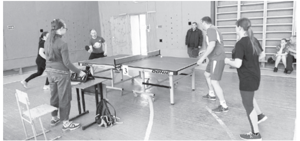
|| Фото из архива СОК «Исеть»