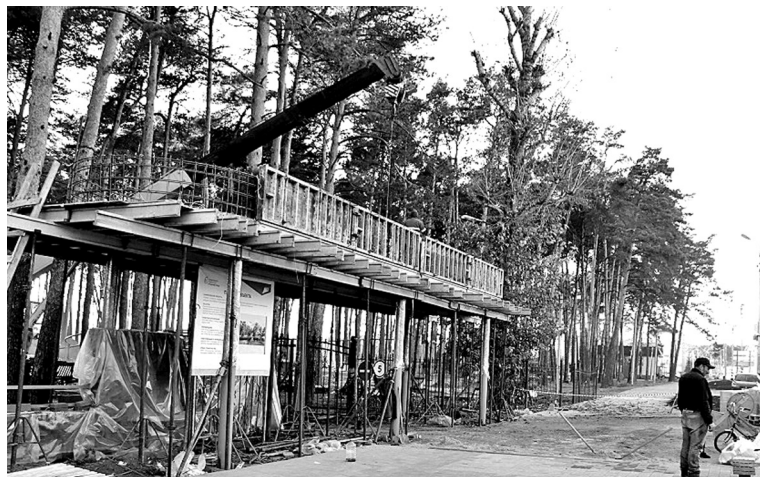
• Благоустройство центрального парка в Заводоуковске в самом разгаре. Октябрь 2021 года.

Татьяна ВОЕВОДИНА