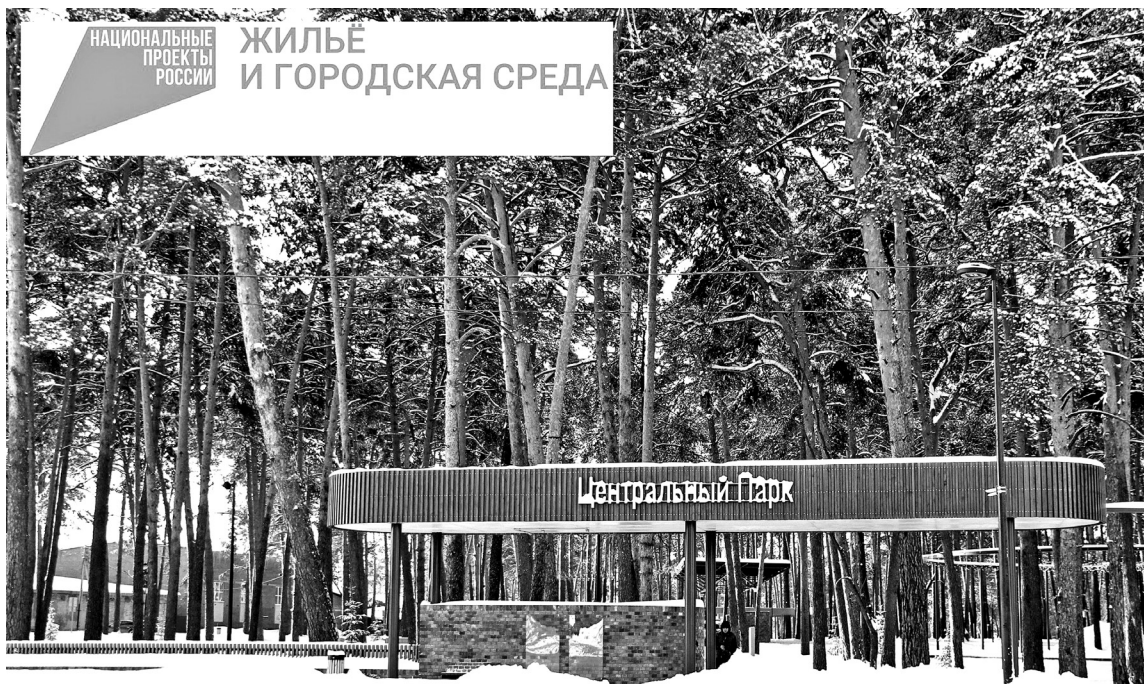
• После обновления центральный парк превратился в точку притяжения земляков и гостей города.