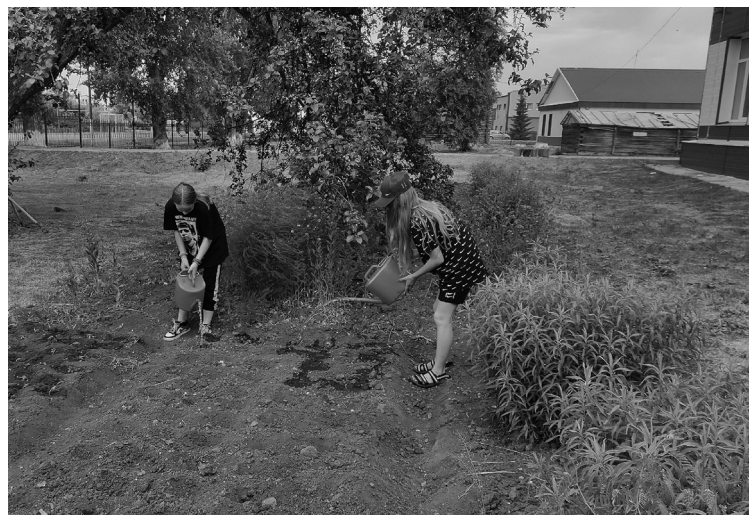
На снимке: трудовая бригада при школе №1

С письменного согласия одного из родителей (попечите-