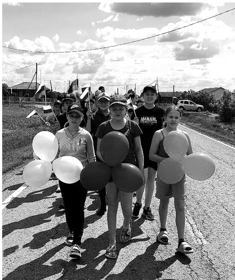
Каждый день в лагере приносит детям новые впечатления

Надеемся, что дни, проведённые в нашем лагере, надолго запомнятся детям и останутся наполненными яркими, светлыми, добрыми впечатлениями, полезными делами и приятными воспоминаниями.