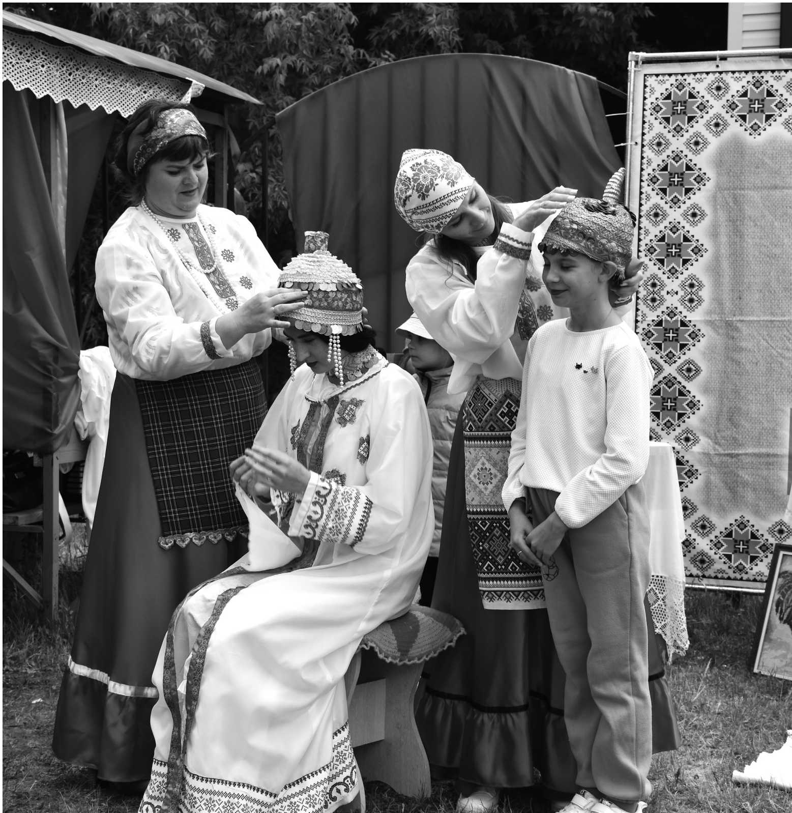
Свадебный обряд чувашей на фестивале представили жители Ворсихинского сельского поселения

печью, украинская хата с тыном, чувашское и мордовское подворья. Разноцветье костюмов, национальные песни и танцы, обрядовые действия, обычаи и традиции, народное творчество и дегустация национальных блюд не оставили равнодушным ни одного гостя праздника. Пышные баурсаки, пироги со всевозможными начинками, гречанники, оладьи, булки, кексы, вареники с творо-