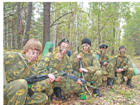
Военно-тактическая игра «Суворовский ратник» г. Ялуторовск. Занял I место. 2013г.