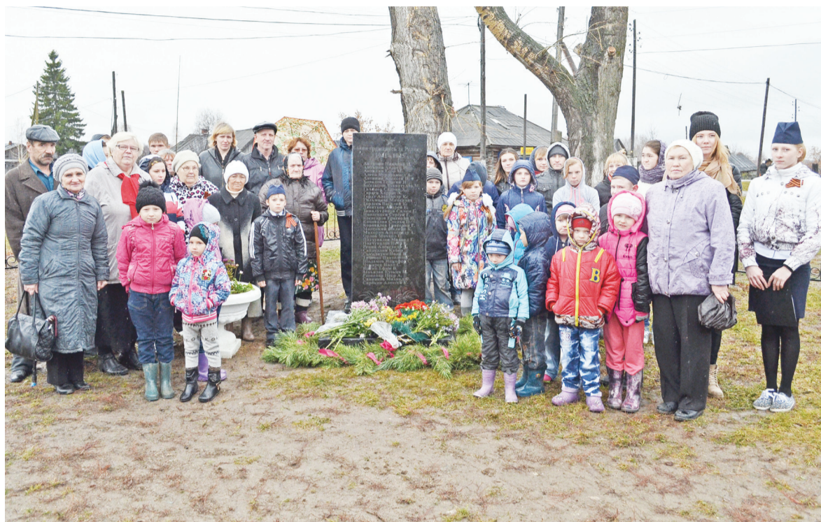
Память времени бег никогда не заглушит!