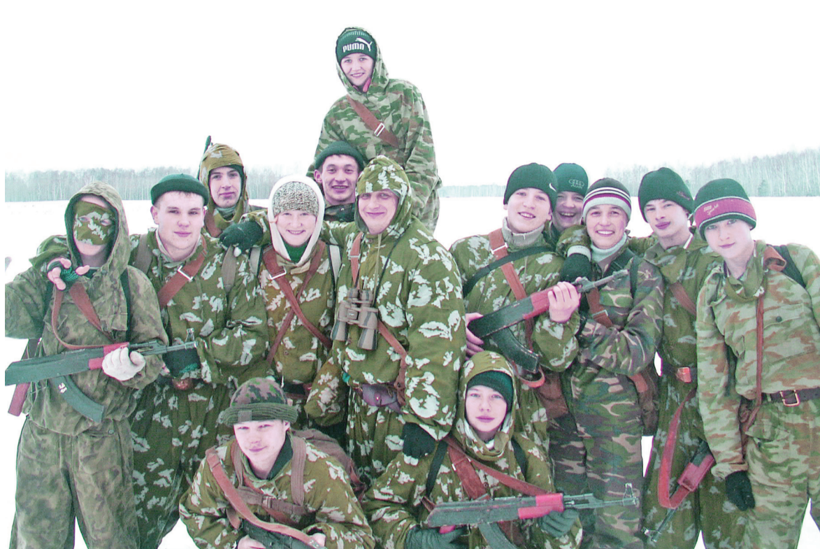
Первый марш-бросок «Русских Витязей». Январь 2006г.

Несомненно, эти навыки пригодятся юным ратникам и в жизни. И родители слушателей специализированных классов довольны, ведь для нынешних подростков самое главное – быть занятыми, востребованными, найти применение своим