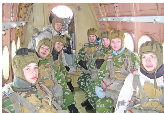
Первые прыжки с парашютом. 8 марта 2006 г.