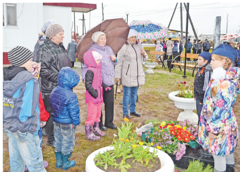
Высока цена такому уроку нравственности.