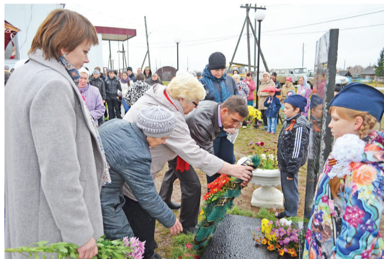
Цветы от благодарных потомков.