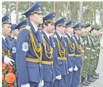
9 мая 2015г.