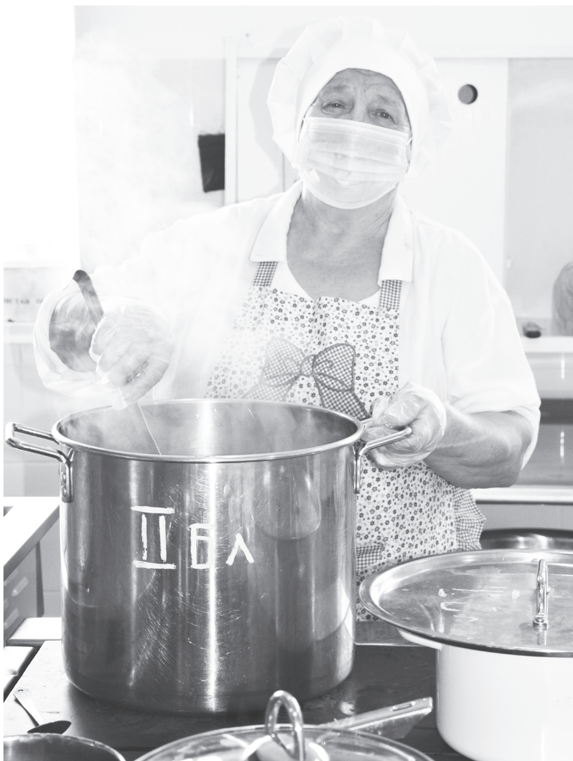
Екатерина Бородина считает, что правильное питание – залог здоровья.