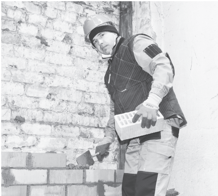
Максим Галкин трудовые задачи выполняет профессионально.