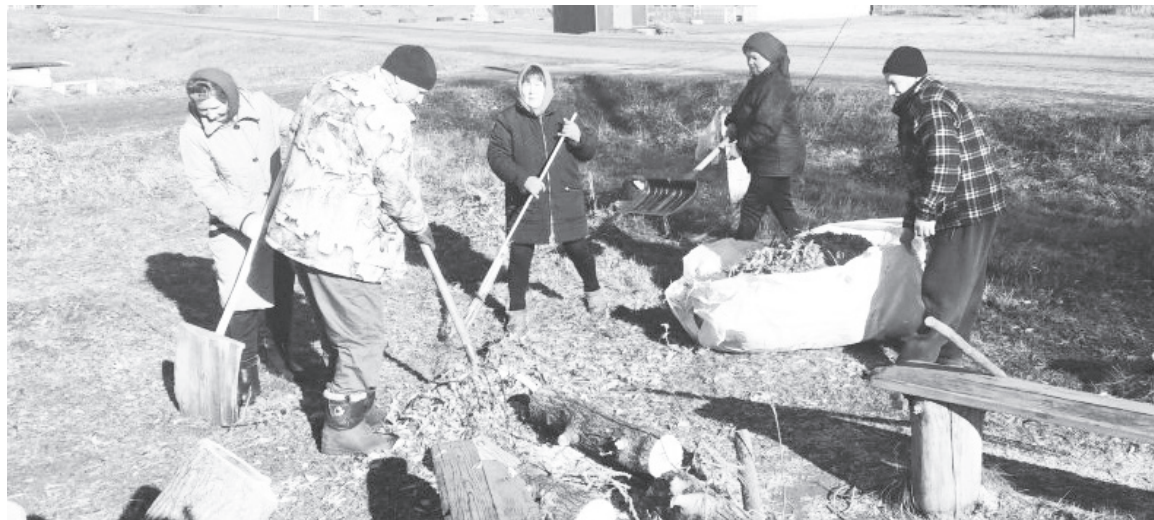
Совместный труд всегда объединяет. Селяне дружно убирали территорию на улице 60 лет СССР.