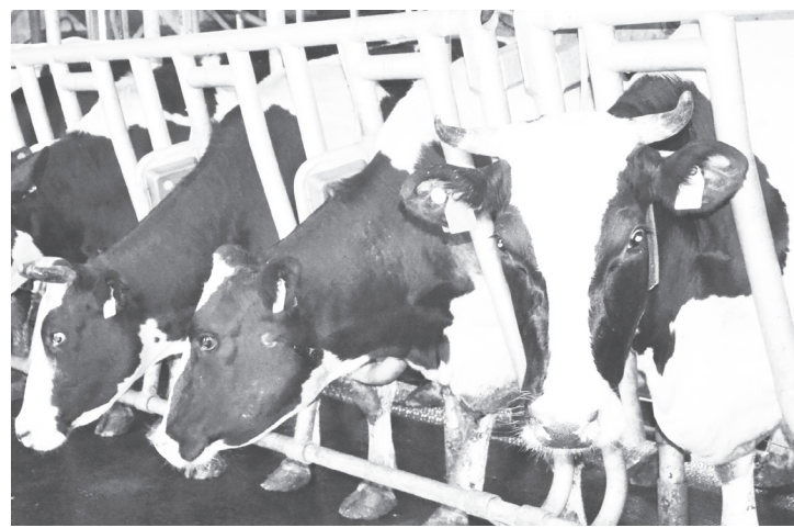
Привезённые животные адаптируются к новым условиям.