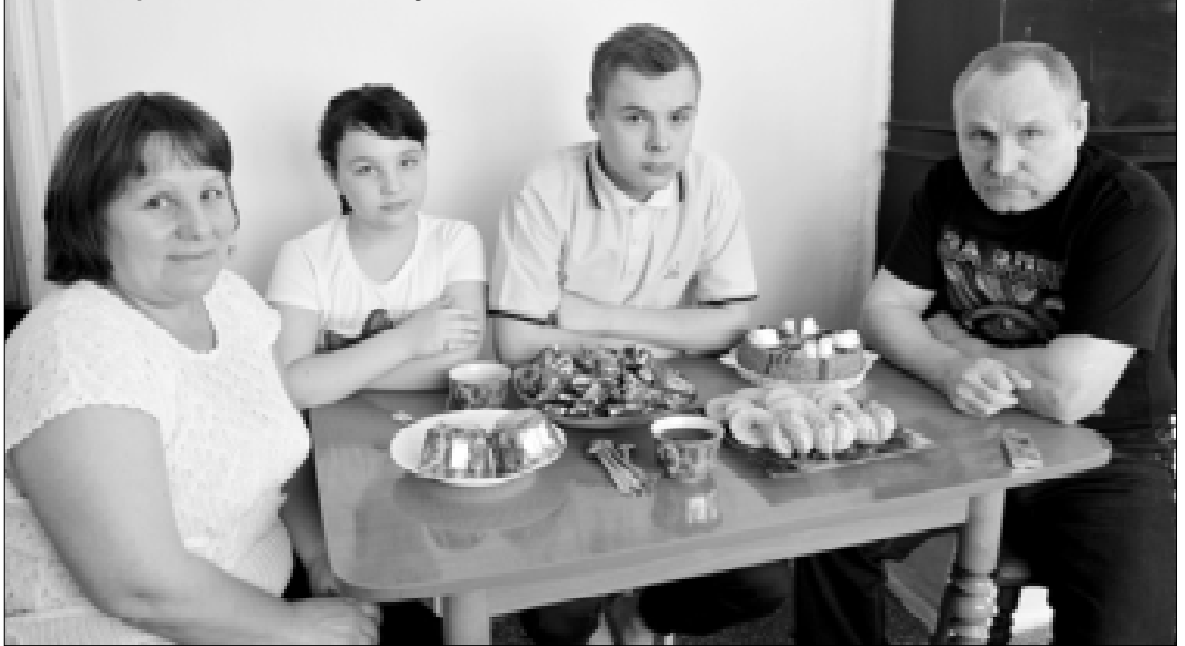
Александр с женой, сыном и внучкой