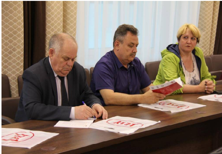
► Представители сельского хозяйства

ет в отдельное помещение. Данные каждого животного прописываются в программе, и если животное по каким-либо критериям недопомогает, то оператор тут же может отправить его в сепарационную зону, где коровой уже будут заниматься ветеринары. Также неоспоримым плюсом такого доения является то, что молоко сразу проходит полный анализ, и производитель имеет представление о качестве продукта. Робот Lely управляется с помощью программы на компьютере, при желании оператор может менять настройки в приложении для смартфона. Один такой комплекс может обслуживать стадо примерно в 120 голов.