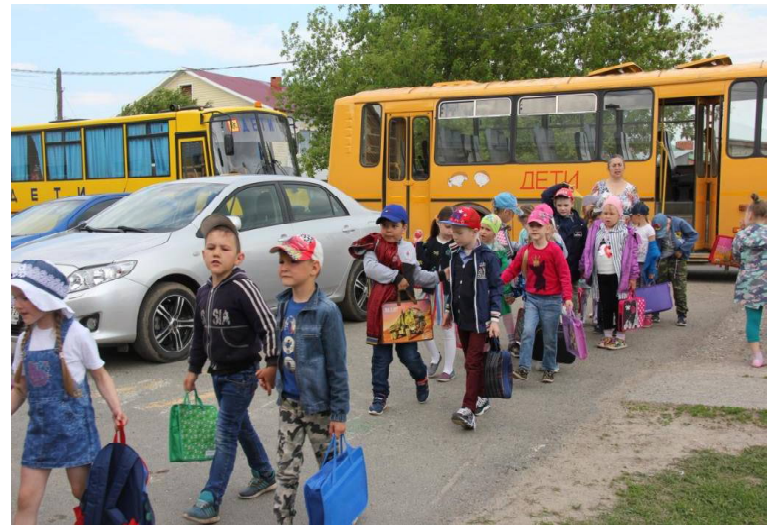
➤ Дети спешат в школу.

Школа будущего первоклассника «Филиппок» со-