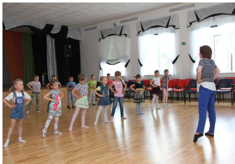
➤ Весёлая физкультминутка.

брала в этом году 84 дошкольника. Всего в день проходит два занятия согласно разработанному графику, и идут они по 30 минут. Между ними – весёлая подвижная 15-минутная перемена.