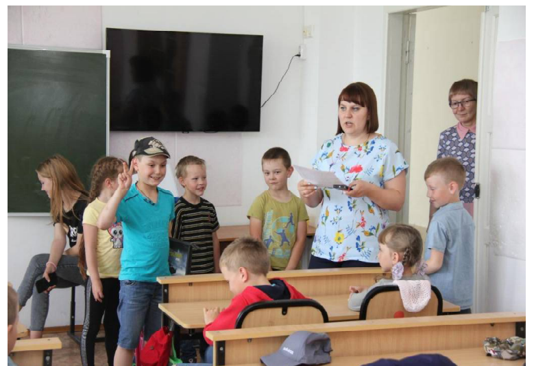
➤ Занятие с логопедом

смотривают за малышами, и играют, и провожают, куда нужно. Новшество в программе школы будущего первоклассника в этом году заключается в том, что в неё включили занятия танцами. Ведёт его педагог С.В. Виснапу. В 2017 году, например, изюминкой смены стало обучение английскому языку («Улица Сезам»). Каждый год организаторы стараются разнообразить программу. – Для нас, как для учителей начальных классов, глав-