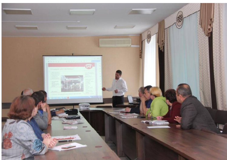
► Представители компании «РОБОТЕКС».

В недалёком прошлом, 27 лет назад, люди впервые смогли запустить полностью автоматизированное доение – был использован робот. За эти годы роботизация молокодоения активно развивалась, и сейчас для фермеров уже доступны роботы пятого поколения. Повсеместно внедряются такие роботы и на территории нашей страны, в Тюменской области они уже появились в Ишимском и Голышмановском районах. 7 июня представители одной из компаний, занимающихся роботизированием ферм, приехали с презентацией и в наш район. Представители компании «Роботекс» рассказали викуловским животноводам об их роботах «Lely Astronaut»: несмотря на то, что этот робот не последнего V, а ещё IV поколения, это настоящее чудо техники. Полностью автоматизированный комплекс, который позволит доить коров до трёх раз в сутки, при этом животные сами заходят в него на дойку, т.е. не нужен человек, который специально их загоня-