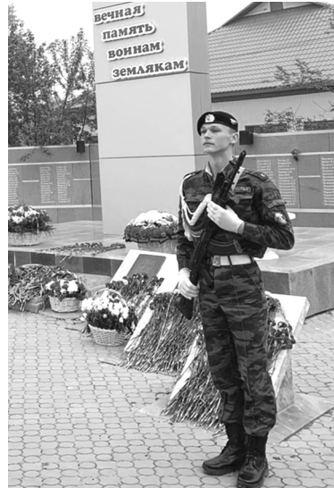
В почётном карауле – кадет Голышмановской сельской школы

По итогам смотра-конкурса почётных караулов отряд медведев-