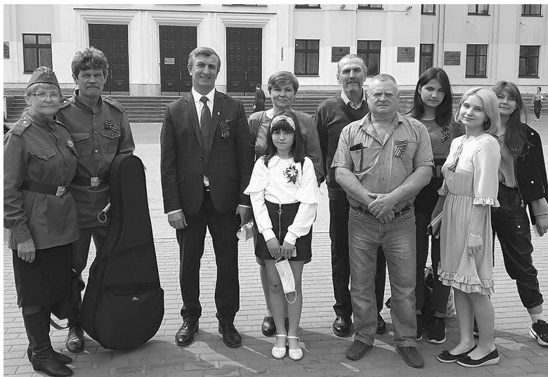
Делегация Голышмановского городского округа

Ирина ЯБЛОКОВА Фото предоставлено автором