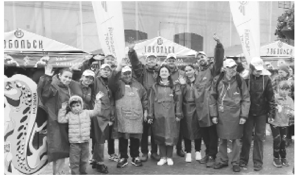
► Лучшую уху сварил коллектив ПАТП