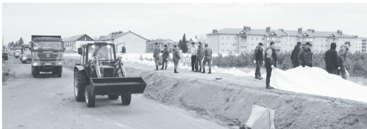
На строительстве дамбы в Упорово трудится большое количество людей из сельских поселений района.