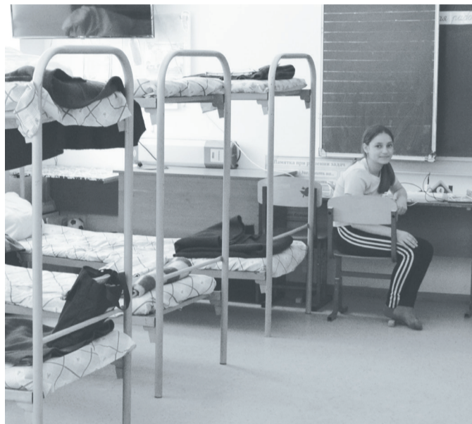
В пункте временного размещения для детей организованы учебные места.