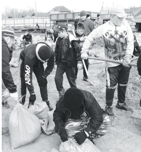
В числе добровольцев чернаковские школьники.