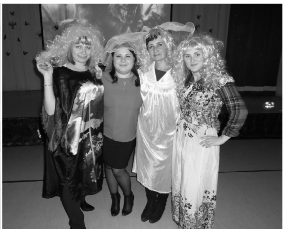
* «А мы не суеверные, мы повеселились от души!».