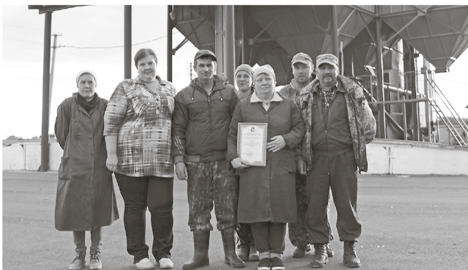
*Отделение «Таволжан» первым закончило уборку урожая в районе.

– В текущем году средняя урожайность в кооперативе 18, 2 центнера с гектара. Это процентов на двадцать