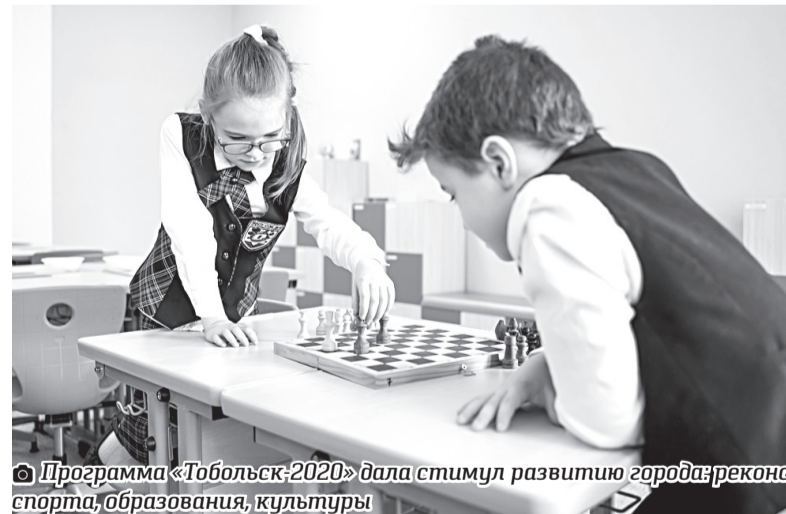
Программа «Тобольск-2020» дала стимул развитию города: реконструированы и построены новые объекты для учреждений сферы спорта, образования, культуры