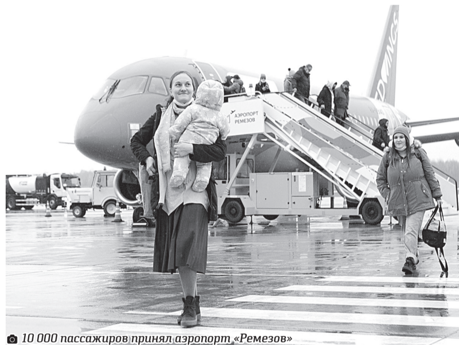
10 000 пассажиров принял аэропорт «Ремезов»

Основными фокусами программы станут проекты благоустройства и озеленения города, формирование общественных пространств, реставрация памятников исторического наследия и создание условий для повышения туристической привлекательности