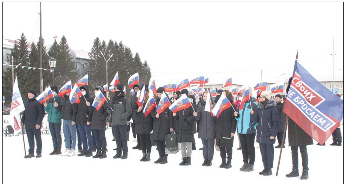
• Флешмоб за мир, за победу.