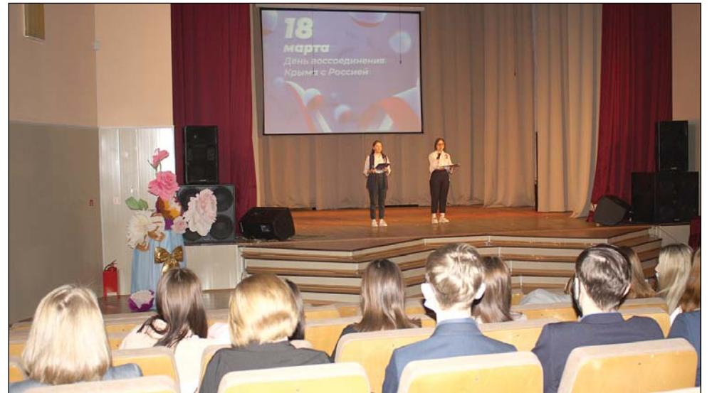
• На тематическом классном часе школьники обогатили знания о Крыме.