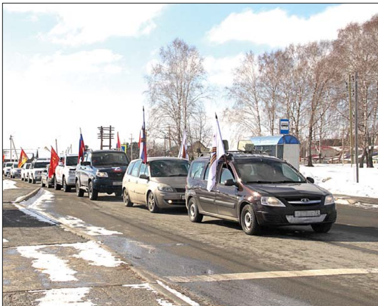
• Автопробег в поддержку спецоперации на Украине.

Торжественный митинг продолжил автопробег под названием «Своих не бросаем». Участием в данном мероприятии аромашевцы показали свою любовь к Отечеству и выразили поддержку российских солдат, участвующих в военной операции на Украине.