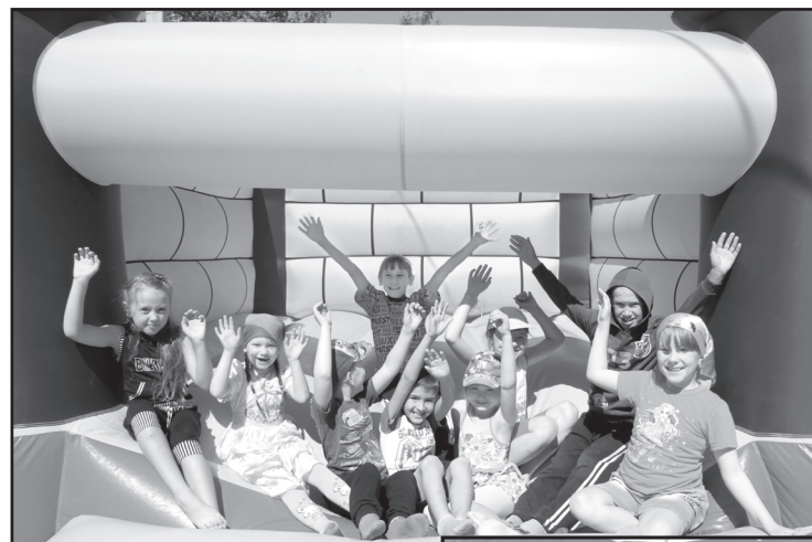
Аттракцион «Весёлый батут»