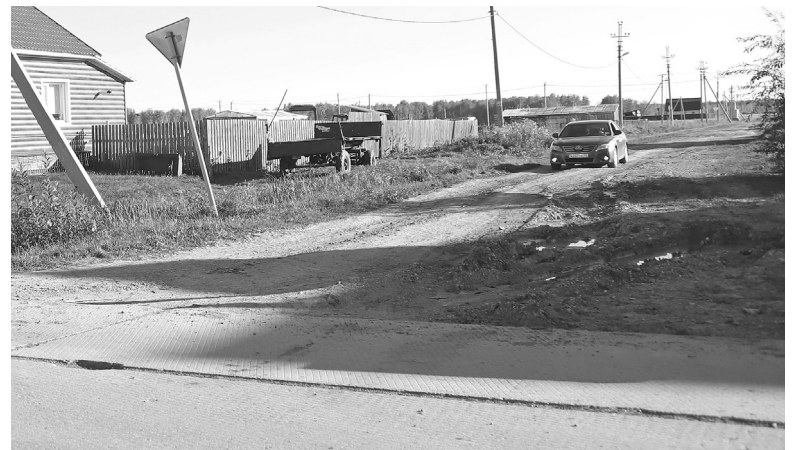
На проблемном участке дороги на улице Куйбышева были выбоины

– В декабре 2024 года депутаты думы Голышмановского городского округа рассмотрят программу дорожных ремонтов в нашем муниципалитете на следующие пять лет – 2025-2029 годы. Тогда и станет известно, запланируют ли в эту пятилетку и ремонт проблемного участка дороги на улице Куйбышева. Но акцентирую