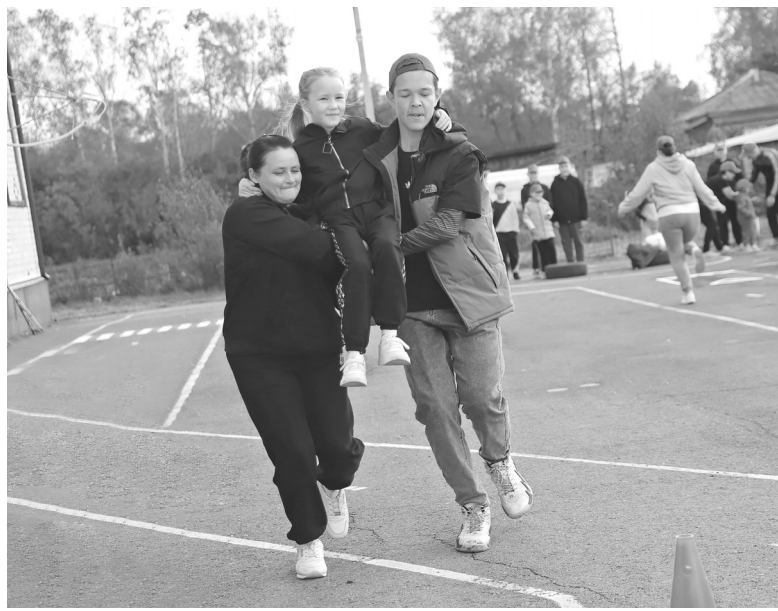
Семейная эстафет: своя ноша не тянет

На праздник приехали делегации с соседних территорий – из деревни Боровлянки и села Усть-Ламенка.