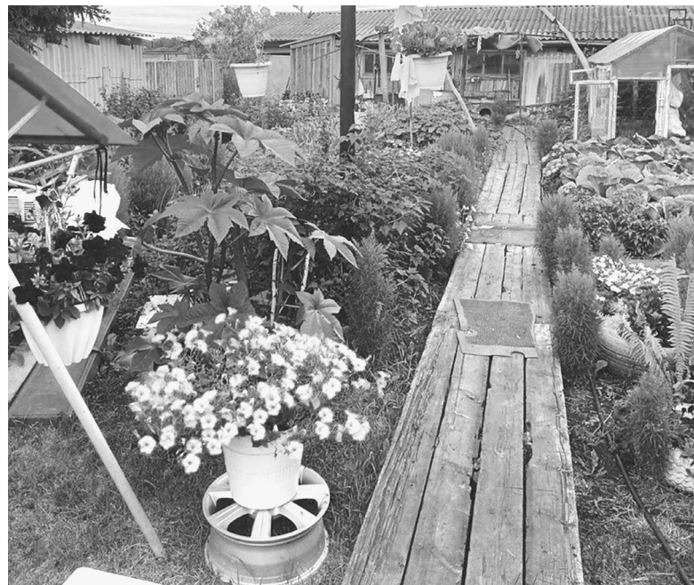
Ухоженный приусадебный участок семьи Алексеевых