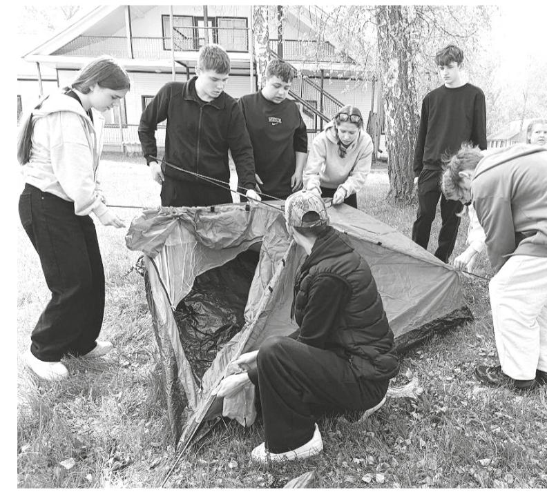
■ На снимке: Туристами не рождаются — туристами становятся за секунды до финиша

Вернувшись домой уставшие, но бесконечно счастливые. Потому что сделали это сами. Отметим, что поход прошёл в рамках всероссийского проекта «Походы первых — Больше, чем путешествие» (Движение первых и программа Росмолодёжи «Больше, чем путешествие»). В 2026 году стартовал новый сезон походов «Время открытий», который входит в национальный проект «Молодёжь и дети». Все желающие — школьники, студенты, семьи с детьми — могут отправиться в самостоятельное путешествие по 11 тематическим датам: от Дня семьи, любви и верности. Маршруты бывают разными: от лёгких прогулок на 4–6 километров до двухдневных походов. Как говорит руководитель Росмоло-