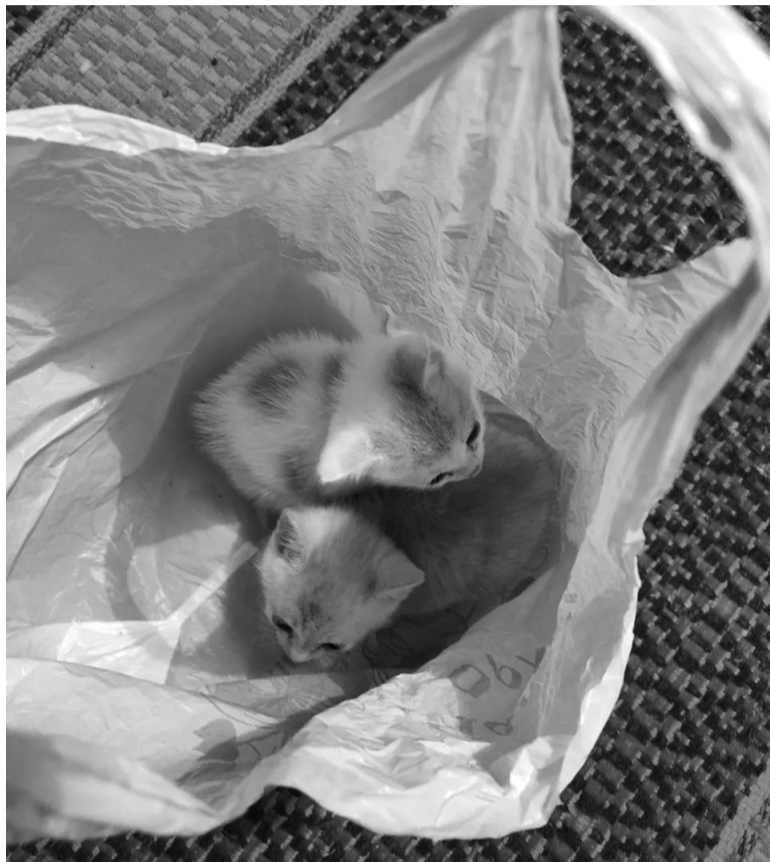
На снимке: Эти маленькие подкидыши уже обрели свой дом и заботливые руки, но сколько их ещё будет?

Первое и главное — это останавливает бесконечное размножение. Одна нестерилизованная кошка или сука за год может принести несколько помётов. Большинство щенков и котят, рождённых на улице или выброшенных хозяевами, ждут голод, болезни и смерть на морозе. Стерилизация и кастра-