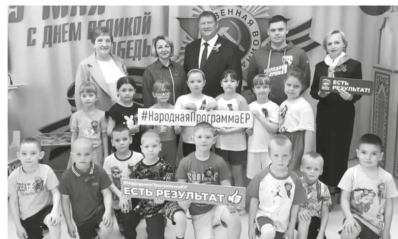
■ На снимках: члены народной комиссии «Единой России» оценивают результаты капитального ремонта социальных объектов Сорокинского округа, выполненных в рамках Народной программы партии

для роста и развития детей. Партия «Единая Россия» уже готовится к выборам в Тюменскую областную и Государственную думы (сентябрь 2026 года), формируя обновлённую версию Народной программы. Каждый житель может внести свои предложения — как онлайн (на сайте estresultat.rf ), так и на офлайн-площадках региона. В преддверии выборов в Тюменскую областную думу и Государственную думу, которые пройдут в сентябре 2026 года, «Единая Россия» приступила к формированию обновлённой Народной программы. Каждый житель региона сможет внести свои предложения на специальном сайте estresultat.rf , а также на офлайн-площадках области.