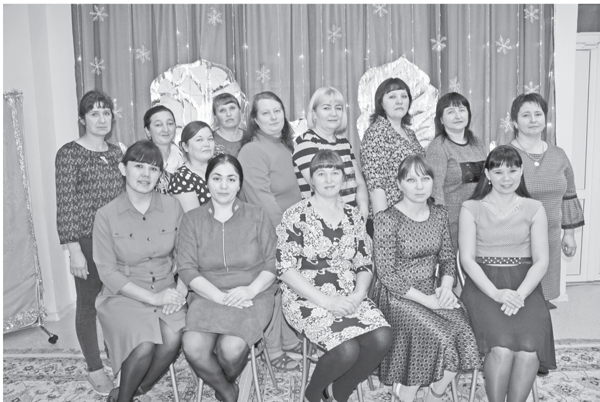
Помощники воспитателей и технический персонал

АДМИНИСТРАЦИЯ и КОЛЛЕКТИВ детского сада «Родничок» СП МАДОУ Вагайский детский сад «Колосок»