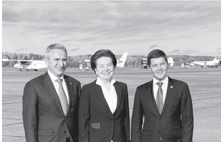
Глава региона отметил эффективное взаимодействие Югры, Ямала и Тюмени

Надо в экстренном порядке заняться наращиванием ка-