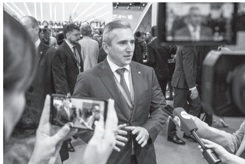
Губернатор оценил работу блогеров и СМИ во время пандемии

Присутствуют в картине нашей жизни и не радующие элементы. Они ни для кого не секрет. Валовый региональный продукт,