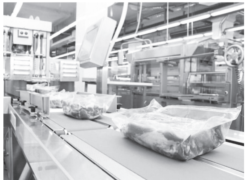
Глава Тюменской области предложил расширить льготы для бизнеса, пострадавшего от пандемии

В-четвертых, раскрепостить, поддержать, а где надо, и подтолкнуть тюменскую предпринимательскую энергию. Да, мы будем убирать с дороги бизнеса всяческие административные рогажки и барьеры и вообще помогать ему изо всех сил. У нас уже есть позитивный опыт проведения в 2020 году Уполномоченным по защите прав предпринимателей в Тюменской области Единого дня отчетности. Давайте расширим этот формат, в том числе его географию. Давайте учредим Единый день консультаций, в котором примут участие