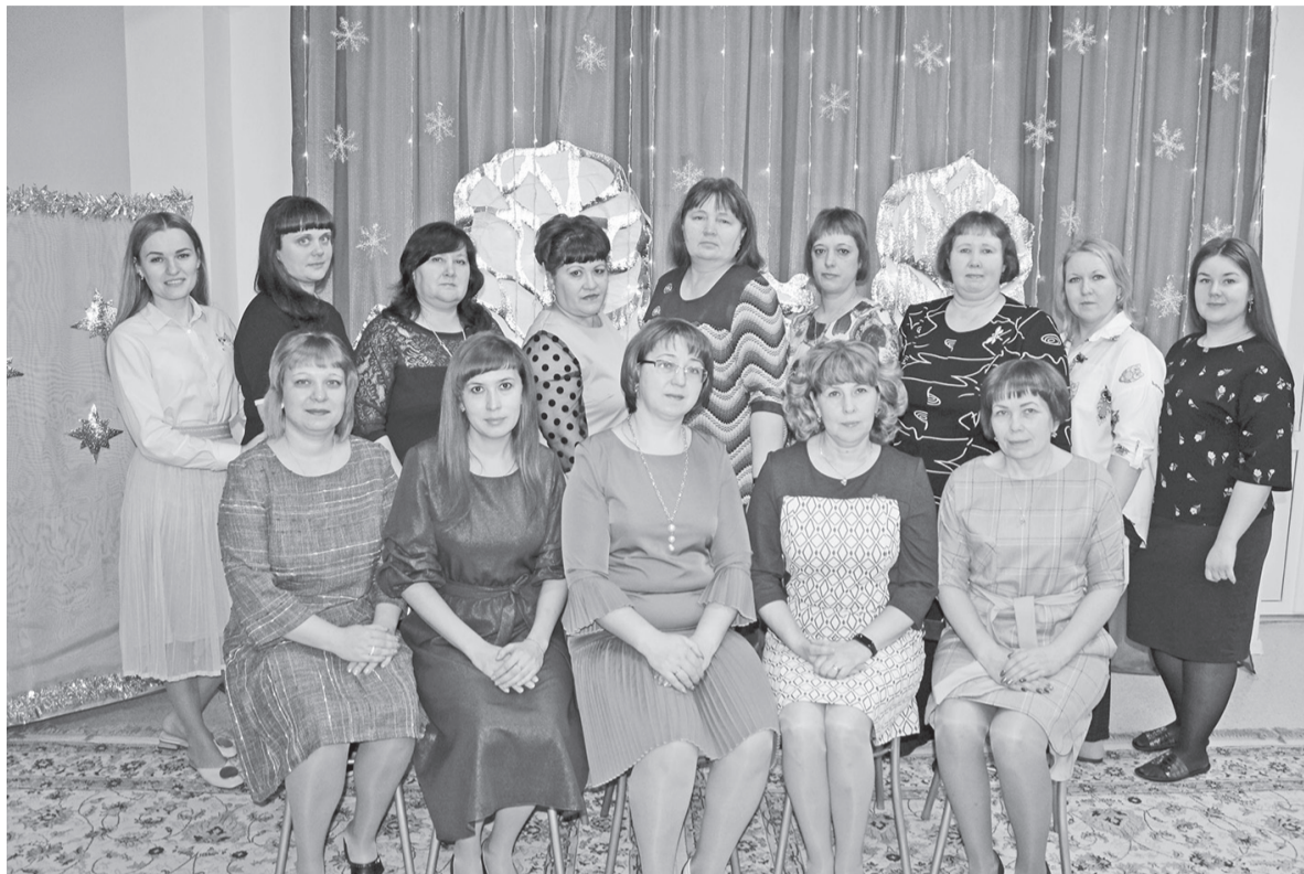
Педагогический коллектив детского сада «Родничок»

Историю нашего учреждения и коллектива создавали инициативные сотрудники – это заведующие, воспитатели, помощники воспитателей, музыкальные руководители, медицинские сестры, повара, завхозы, прачки, кастелянши, сторожа.