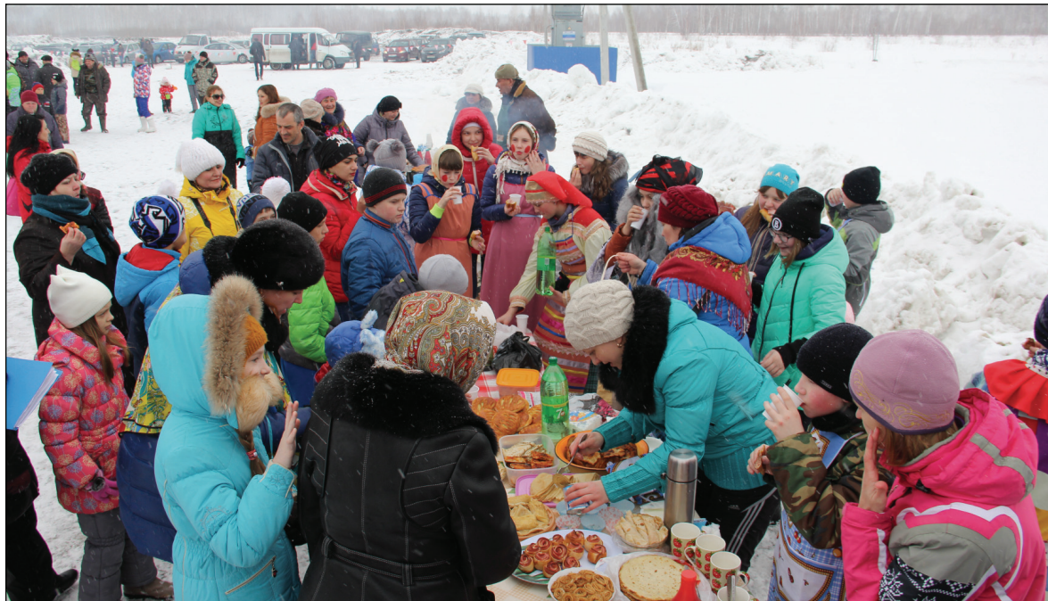
• Вытечка учащихса пользовалась спросом у односельчан.

Три часа продолжались гулянья и развлечения, а закончилось всё сожжением красиво наряженного соломенного чучела Масленицы. Праздник прошёл весело и интересно, думаю, что совсем скоро его аромашевцы будут ждать так же, как и наступление Нового года.