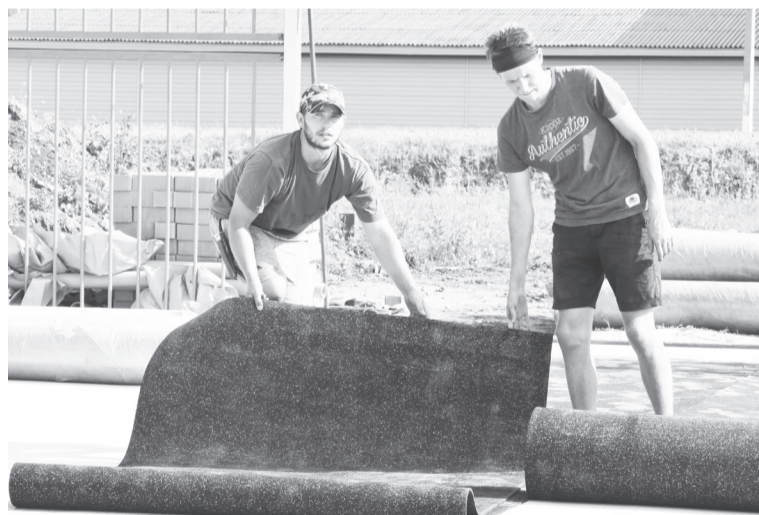
Специалисты ООО «Сигма-сервис» с укладкой покрытия должны уложиться за неделю.

Упоровское поселение на реализацию проекта выиграло грант департамента АПК в размере 3 000 059 рублей. Им была выделена субсидия из областного бюджета 2 000 000 рублей. Остальная сумма – это привлечённые средства. То есть спонсорская помощь и вклад местного населения.