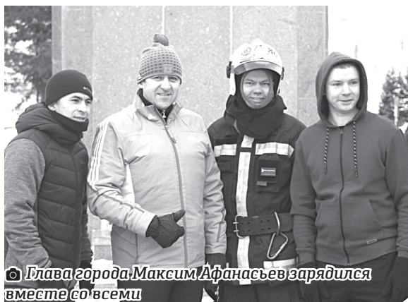
Глава города Максим Афанасьев зарядился вместе со всеми

Это воскресеньем поклонники лёгкой атлетики начали с дружной пробежки по тобольским улицам от площади Менделеева до кремля и обратно. Отметим второй фестиваль бега и скандинавской ходьбы «Менделеевский заряд»