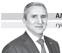
АЛЕКСАНДР МООР губернатор Тюменской области