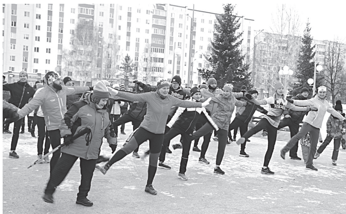
Зарядка перед забегом