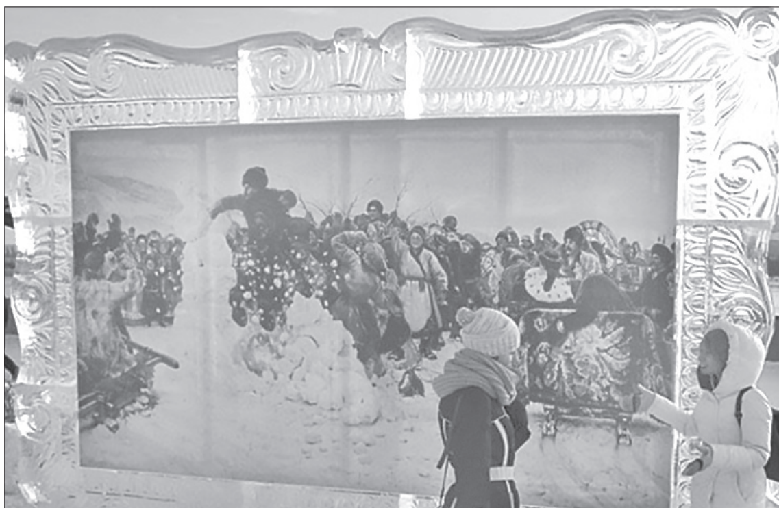
Знаменитую скамью Врубеля и раму для картины «Взятие снежного городка» изготовят из льда /СЛАЙДЫ ИЗ ПРЕЗЕНТАЦИИ

27 декабря в ДК для пожилых горожан организуют ретро-программу. Концерт «Зимние узоры» пройдёт в детской школе искусств 20 декабря. Центральная библиотека приглашает на аттракцион иллюзий «Алиса в Зазеркалье». Молодёжный центр и театр «ФОРМАТ» готовят к премьере сказку «По щучьему велению» в современном прочтении. Ёлка главы состоится 25 декабря.