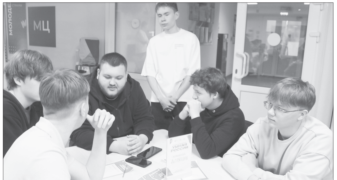
Кажется, после победы в интеллектуальном квизе студентам из команды «Должники» долги по истории, если они есть, можно и закрыть

- У нас прошло шесть туров среди школьников, студентов и рабочей молодёжи, а также гранд-финал, где выявили одного победителя. В город-побратим Ялуторовск мы приехали провести одну игру, также организуем встречу в Губкин-