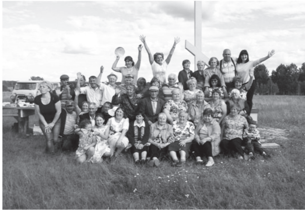
Участники встречи в деревне Евстафьевой

Но природа-матушка оказалась к нам благосклонной. После затяжных дождей утро этого дня оказалось солнечным, теплым, радостным. И потянулась техника, вездеходные машины, болотоходы, трактора, по полям, по лесам в деревню, от которой осталось лишь только название. Произошло оно от мужского имени Евстафий, что в переводе с греческого означает «уравновешенный, крепкий, здоровый». В списке населенных пунктов, по данным 1962 года, эта деревня значилась самой большой на территории Ашлыкского сельского совета. В похозяйственной книге числилось 46 дворов, где проживали 169 жителей. На схеме деревни, что была подарена всем участникам встречи, значатся мельница, кузница, часовня, сушилка, магазин, водоканка, пилорама, конный двор, зерноток, клуб, ферма, больница, молоканка, школа. Теперь же