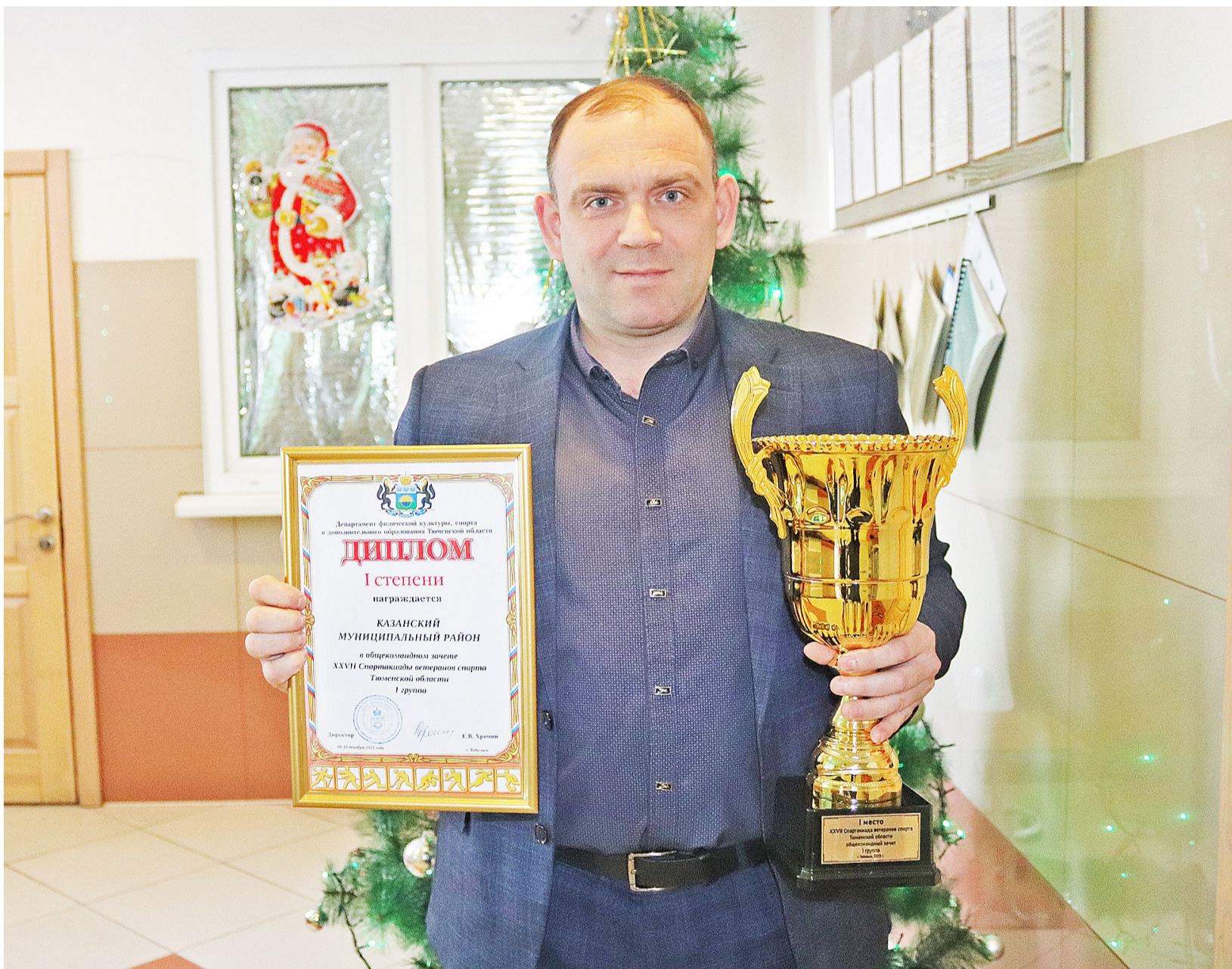
Очередной трофей стал достоянием казанской спортивной школы

В Тюмени в легкоатлетическом манеже 8 декабря подвели итоги областного конкурса «Спортивная элита – 2023». Названы имена 14 победителей и 63-х лауреатов в 16 номинациях, которые будут навсегда внесены в летопись «Спортивной элиты» нашего региона. Это спортсмены, тренеры, работники физической культуры, спортивные федерации, муниципальные образования и те, кто внёс значимый вклад в развитие физической культуры и спорта в Тюменской области в 2023 году.