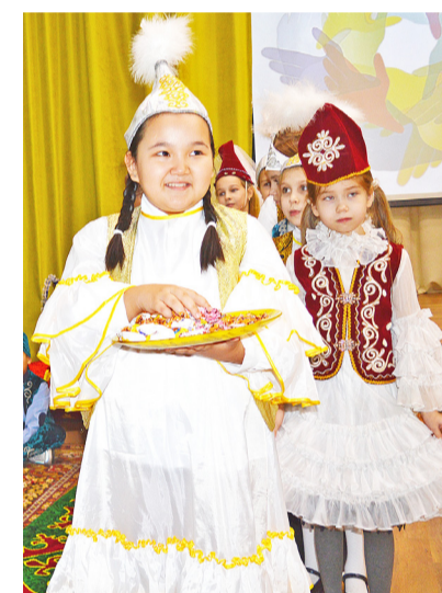
Казахский обряд «шашу» (осыпание сладостями) вызвал бурю эмоций у детей и взрослых