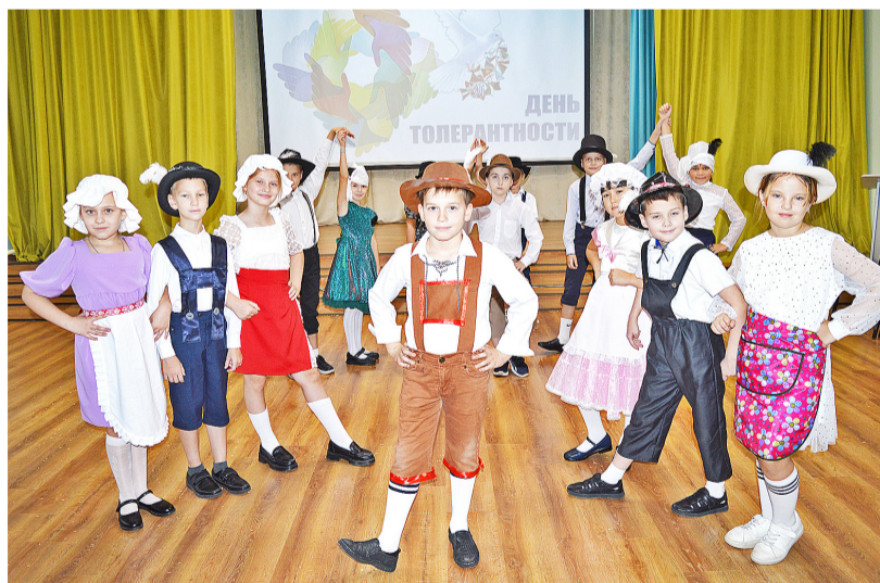
Новоселёзневские школьники весело исполнили немецкий танец

вал остальным. Ученики средних и старших классов подготовили тематические выставки, учащиеся начальной школы показали творческие номера.