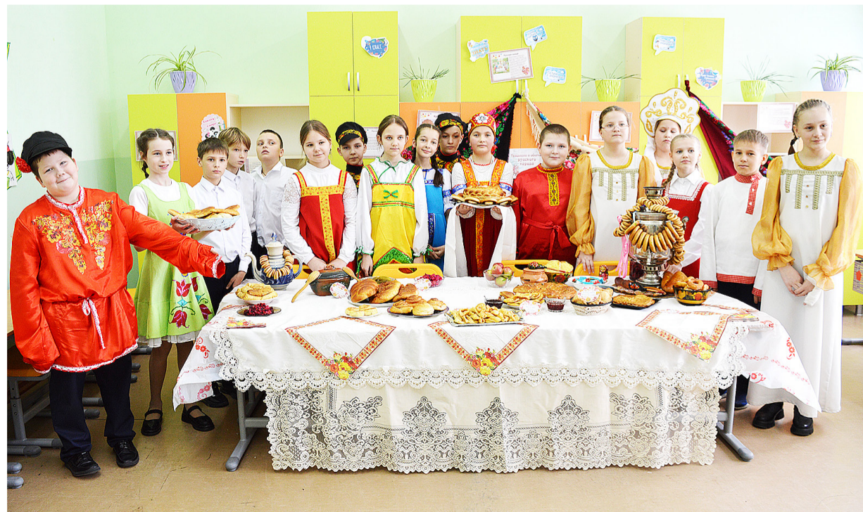
Учащиеся Казанской начальной школы хлебосольно угощали гостей блюдами традиционной национальной кухни