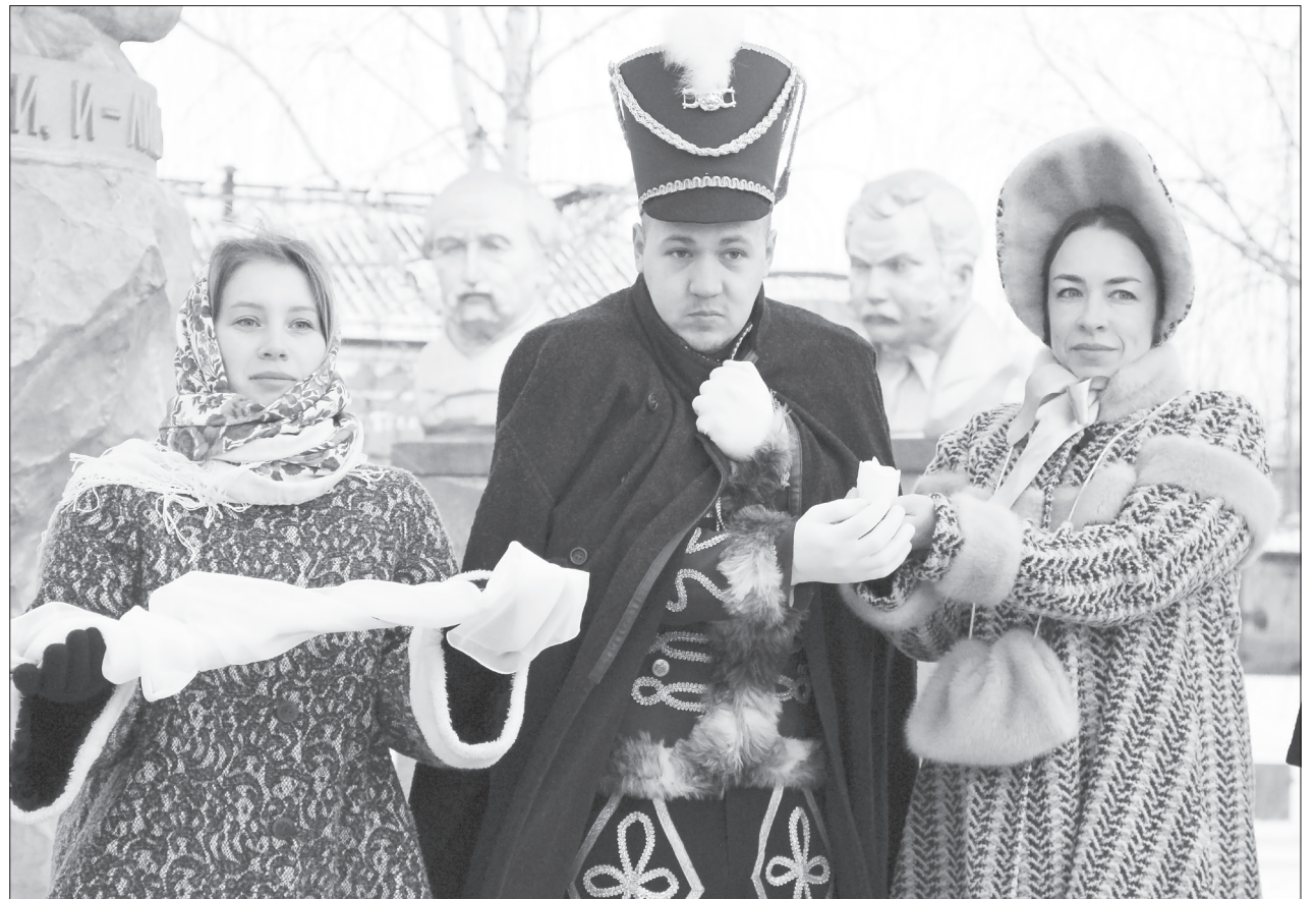
Традиционным символом фестиваля является не меч, а свеча - как знак образования и культурного наследия декабристов в нашем городе

Чашку кофею. Сейчас в процессе реставрации у нас находятся знаковые объекты: дом Матвея Муравьёва-Апостола и деревянное здание школы