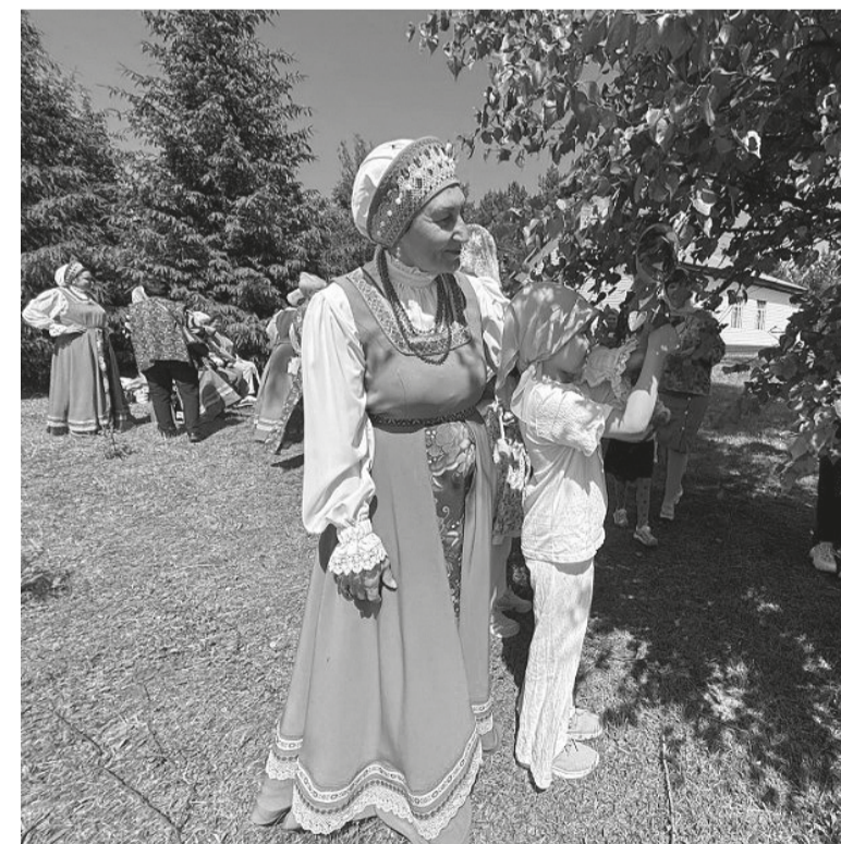
На снимке: Песни, танцы и тёплые слова настоятеля — таким запомнился праздник Святой Троицы в Большом Сорокине