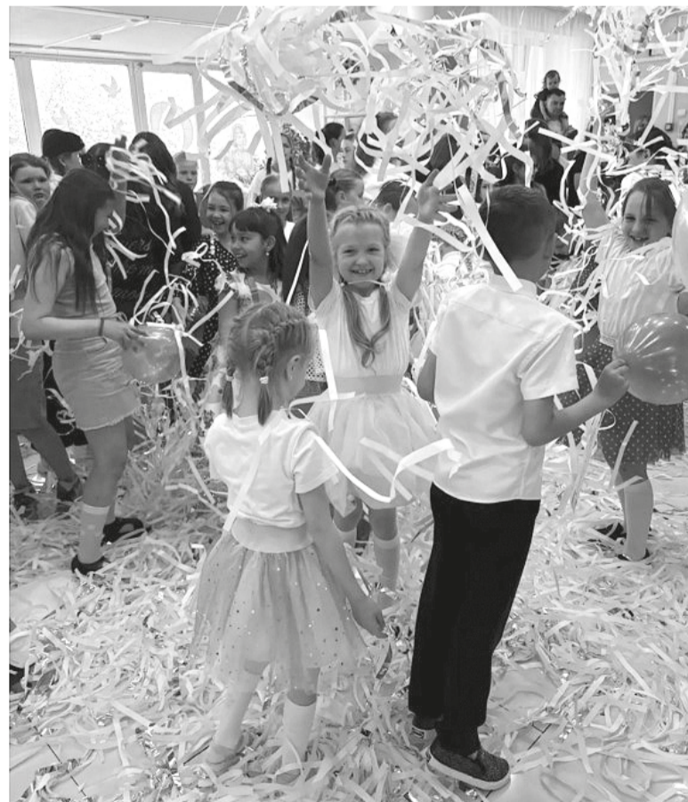
На снимке: Бумажное шоу доставило детям настоящее удовольствие

А на прощание каждому ребёнку подарили воздушный шарик — как символ лёгкости, свободы и того, что учебный год завершился, но творчество не заканчивается никогда. Центр детского творчества благодарит всех ребят за энергию, улыбки и талант и приглашает снова — за новыми открытиями, верной дружбой и, конечно, новыми красками.