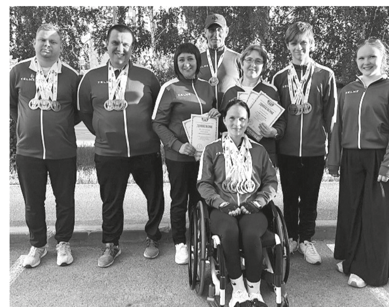
На снимке: яркие моменты Спартакиады