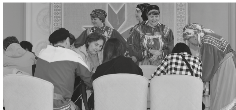
Гостевины в мордовскую культуру «Инечи»: 24 мая, ЦКР им. Гейко. Традиция ожила.

Вот так лошадь, орнамент, игра и блин стали проводниками в мир, который многие знают только по учебникам. А оказалось — он живой, тёплый и готов обнять каждого, кто переступил порог.