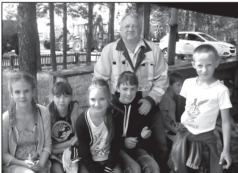
На экскурсии в ДРСУ