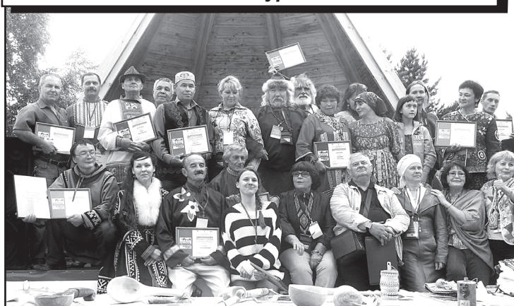
Участники конкурса профессионального мастерства