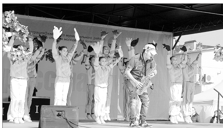
Музыка для настроения.