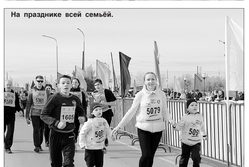
На празднике всей семьёй.