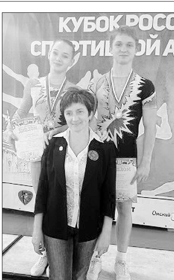
КУБОК РОССИИ ПО СПОРТИВНОЙ АЭРОБИКЕ