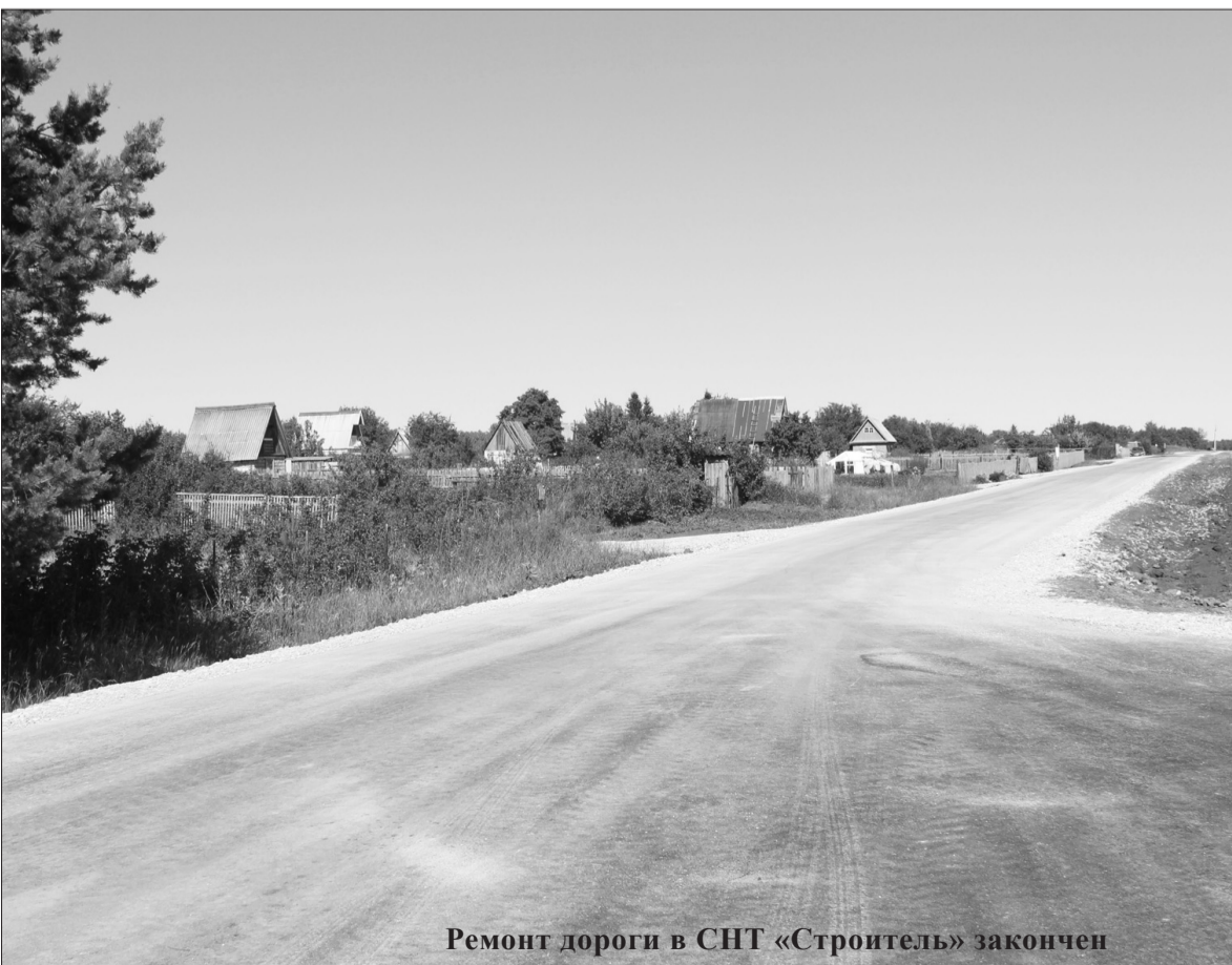
Ремонт дороги в СНТ «Строитель» закончен