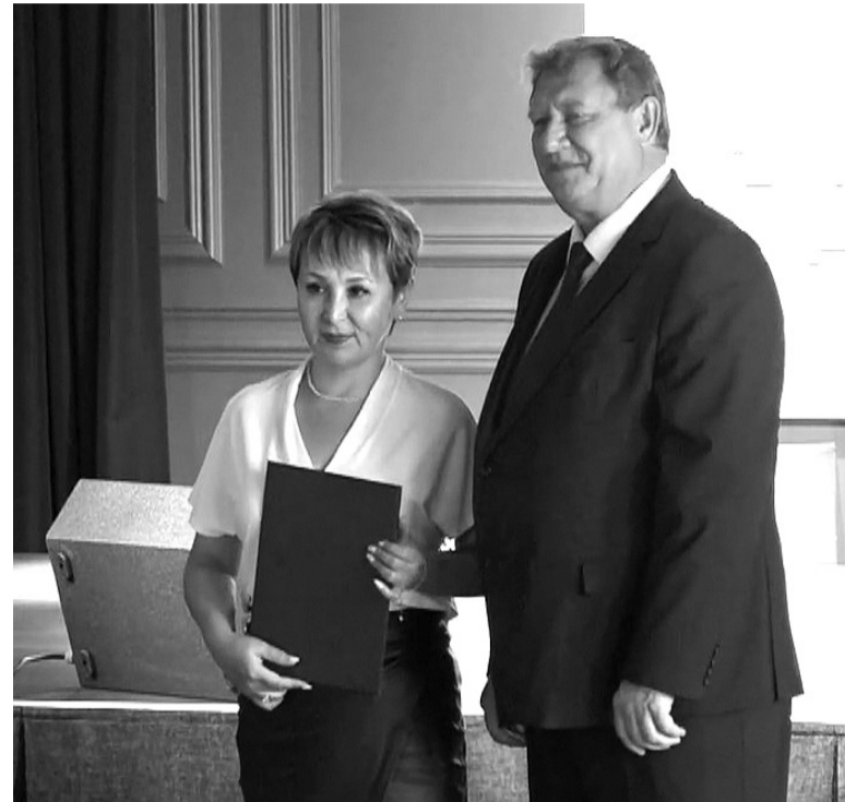
На снимке: на награждении

Почетные грамоты главы Сорокинского муниципального округа за большой личный вклад и высокое профессио-